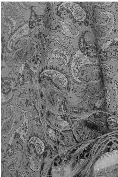
Рис. 2. Шелковая ткань. Тебриз, XIX в. XVII в. или ранее. Коллекция Orient Stars. Гаджарский музей, Тебриз

Обычно дракон изображался в виде огромной крылатой змеи с рогами и гривой. Но в азербайджанском народном прикладном искусстве, особенно в коврах и текстильных изделиях, часто встречаются изображения дракона в виде, напоминающем букву «S». Это было связано с изображением текущей воды и движения облака в небе [17, 84]. «S»-образные мотивы вошли в орнаментально-декоративную систему как мотив дракона, символизирующий дожди и воду, и как следствие, плодородие и изобилие. Со временем этот символ в виде буквы «S» канонизировался и в таком устоявшемся виде используется по сей день.