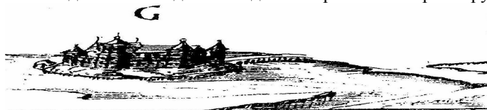
Рис.3. Зображення типового дерев'яного замку XV-XVI ст. на острові в оточенні мочар. (За Ю. Нароновичем-Наронським)

З південної і південно-східної сторони по периметру городища між