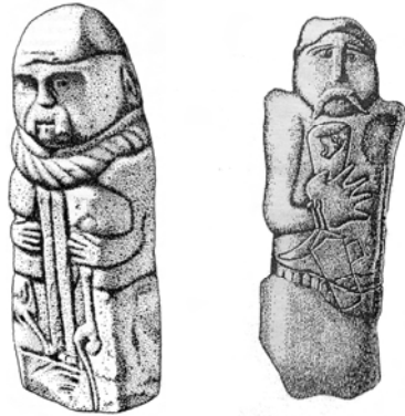
Кам'яні «баби» запорожцям IV ст. до н. е. 37

«Трактату про дві Сарматії» він перетворився в Аскард 40 . Так, якщо в XIX ст. Гаркаві А.Я. перекладаючи Ібн-Хаукля (X ст.) Гард називає Артом 41 , то в перекладі Коновалової І.Г. (2000) Аль-Ідрісі (XII ст.), який теж посилається на Хаукля, місто вже називається Арсою 42 , а в перекладі Бейліса В.М. (1984) того ж Ідрісі Гард і зовсім перетворився в Арсані 43 .