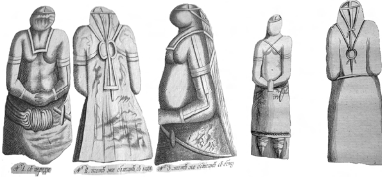
Мал. кінця XVIII кам'яних «баб» з Товстої могили та в 22 верстах над могилою на Інгуглі 36

спотворення нашої історії знаходимо в перекладах відносно столиці Гарду. В перекладі М. І Стеблін-Каменського (1980) ісландського автора Сноррі Стурлузона Азгард називається Асгардом 38 . В «Античній географії» за