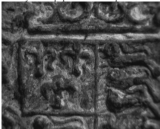
Торгова пломба-медальйон. Макропломба

Флорівського монастиря в Києві і була інтерпретована як торгова пломба другої половини XVI ст. [2, 25]. Проте вона була двосторонньою та містила у верхній частині вушко для кріплення до товару. Виходячи з наведеного опису, бачимо, що знахідка – половина двохсторонньої пломби, де іншу (реверсну) площину втрачено. Після привозу товару (сукна з Англії чи Фландрії) [3] пломбу було знято, розділено, модифіковано вушко, і аверс бувшої пломби використовувався як прикраса, на зразок нинішніх медальйонів. У цьому випадку наша назва «Торгова пломба – медальйон» є цілком правочинною, оскільки відбиває усі аспекти даного виробу. В лабораторії ІА НАН України для отримання більш повної інформації було проведено спектральний аналіз речі. Встановлено, що свинець має домішки, в тому числі і золото (Додаток 1). Питання атрибуції наявності тут золота наразі встановлюються, проте якщо є достатньо доведеним її повторне використання цілком можливим є його поява уже в якості позолоти, після втрати виробом своїх первісних товарних функцій. У цьому аспекті крім аналізу досить показовими є макрознімки виробу, де досить чітко видно концентрацію золота у виїмках рельєфного зображення (Фото 2).