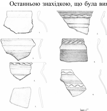
Таблиця I. Крупа 2011. Розкоп № 1. Споруда № 1. 1–7—кераміка

Останньою знахідкою, що була виявлена на долівці споруди під шаром попелу, була торгова plombа – медальйон (Фото 1). Виріб круглої форми, 4,1 см в діаметрі, в нижній частині - три наскрізні отвори для додаткового кріплення на одязі, у верхній частині міститься вушко для підвішування. На аверсі зображений англійський герб та напис латиною по колу: „Noni soit qui mal u pense”, що перекладається як «Ганьба тому, хто погано про це подумає».