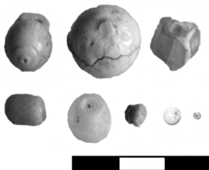
Рис. 7. Намистини

Ще однією категорією скляних виробів є світло-жовті, блакитні та білі намистини . Форма їх кругла, циліндрична та у вигляді чотирикутної призми. Діаметр намистин становить приблизно 0,3-0,9 см (Рис. 7).