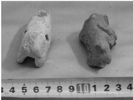
Рис. 5. Фрагменти дитячих свищиків

На гл. 3,2 м глиняна люлька з зеленою поливою, чашка бита, орнаментована двома круговими та трьома горизонтальними лініями. Загальна довжина 4,0 см, Øотвору мундштука 1 см, внутрішній Ø чашки 1,6 см.