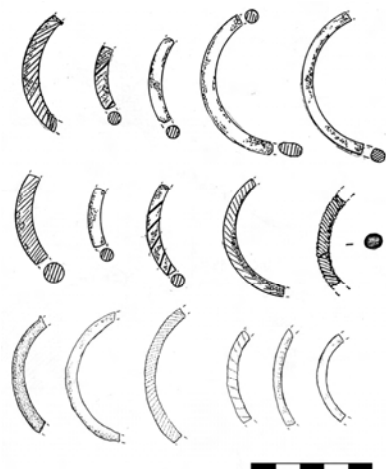
Рис. 6. Фрагменти скляних браслетів

Одним із цікавих керамічних виробів, виявлених під час розкопок, є два фрагменти керамічних дитячих свищиків (Рис. 5).