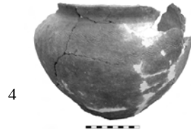
Рис. 2. Посуд періоду Луки-Райковецької культури

прокреслені хвилеподібні парні в два рядка лінії; по тулубу виявлено наліплений валик з косими насічками.