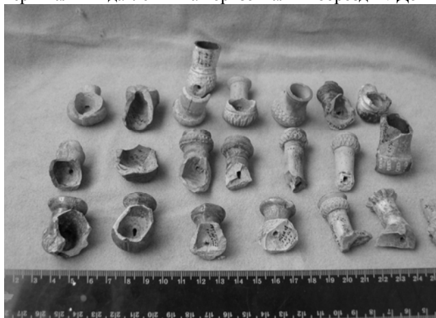
Рис. 4. Фрагменти козацьких люльок

штампований лінійний орнамент. Довжина 3,8 см, внутрішній \varnothing чашки 2,5 см. На цій же глибині виявлено ще один фрагмент люльки. Випал нерівномірний. Мундштук та чашка биті. По чашці зафіксовано ір'євидні вертикальні вдавлення та горизонтальні бороздки. Довжина 3,5 см, зовнішній