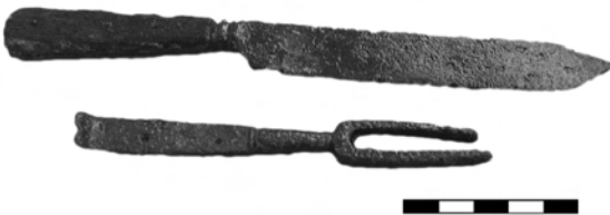
Рис. 8. Металеві вироби: ніж та виделка

Вага енкалпійона становить 54,93 г. Загальний розмір 8,2x5,7 см (6,5x5,7 см без петель кріплення). Енкалпійон виготовлений шляхом лиття. Кінці