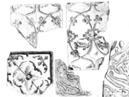
Рис. 3. Кахлі

На гл. 1,4 м ще один фрагмент люльки світло-коричневого кольору, частина мундштука та половина чашки відсутні. Знизу