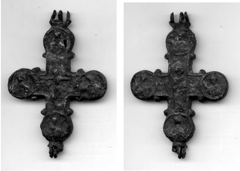
Рис. 9. Бронзовий енкалпійон: лицьова та зворотна сторони

Фрагмент залізного ножа. Лезо сильно пошкоджено корозією, загальна довжина – 8,3 см, ширина біля рукоятки – 0,6 см;