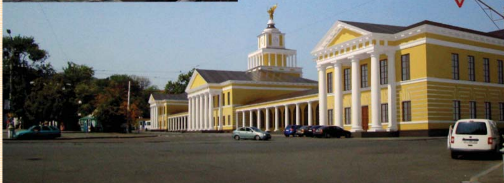
Проект Юрія Лосицького. Головний та задній фасади. Перспективи.