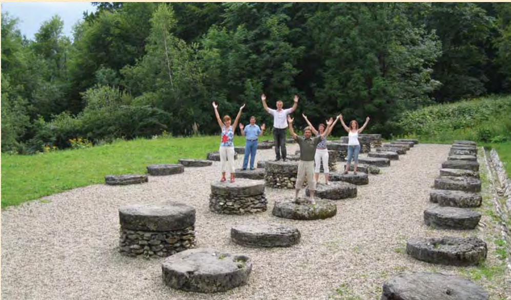
Група київських архітекторів на залишках храму I ст.