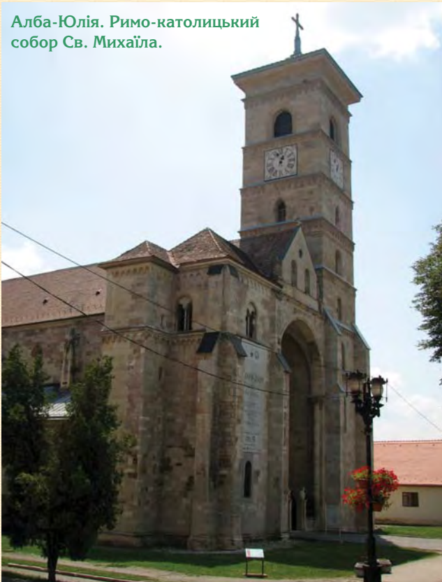
Алба-Юлія. Римо-католицький собор Св. Михаїла.