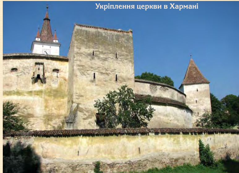
Укріплення церкви в Хармані

Укріплена церква в селищі ХАРМАН . Саксонська назва його — Хонігберг — "гора меду". Поруч, у лісі, місцеві жителі дійсно брали мед. Один із найбільших укріплених храмів Трансильванії. Площа Хонігбергу — 14,5 тис.кв.м, периметр — 430 м. Товщина стін — 4 м, висота — 12 м, підсилена сімома 4-поверховими вежами. В одній з них зберігся розпис XV ст.