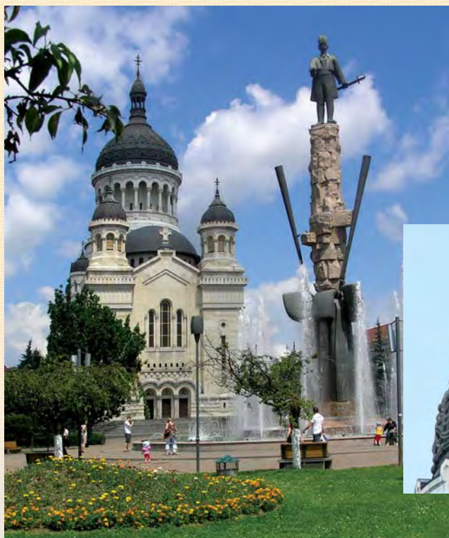
Клуж-Напока. Православний собор. Фрагмент бані.

Прямуючи далі на південь, долаємо ряд високих гірських перевалів і потрапляємо до наступної області країни — ТРАНСИЛЬВАНІЇ . Цей маль-