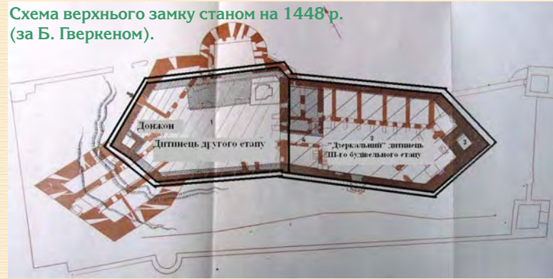
Схема верхнього замку станом на 1448 р. (за Б. Гверкеном).

Зі східного боку прибудовано оборонні мурі нового дитинця (1180 м 2 ), теж видовженого і п'ятикутного в плані з квадратною баштою у східному наріжнику. До східної стіни первісного замку прибудовано житловий будинок