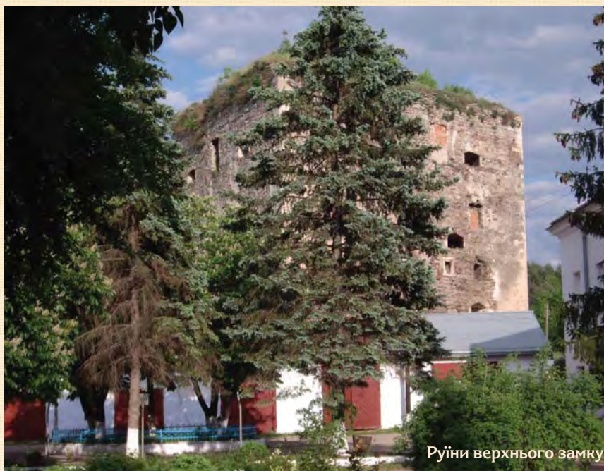
Руїни верхнього замку

дитинці з північного боку Миколю та Ієронімом Язловецькими прибудовано велику півкруглу бастею (2) (в зв'язку з чим розібрано старий будинок з криницею), перебудовано західну і північну стіни, біля яких споруджено новий житловий будинок. В східному дитинці до південної стіни у 1599 році прибудовано каплицю, до північної — двоповерховий дім.