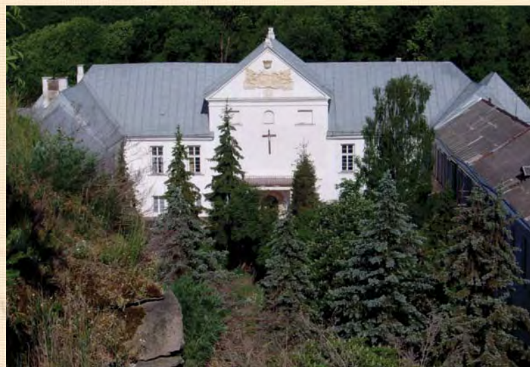
Контури верхнього замку (сучасний стан).