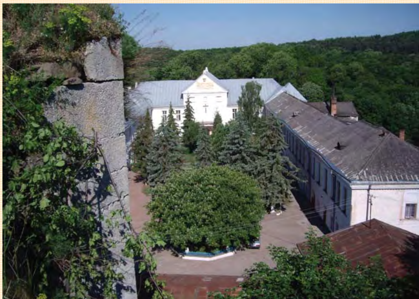
Комплекс нижнього замку.

В руїнах власне (верхнього) замку чітко виражені обриси початкової закладки (другий етап будівництва), котра в плані має нерегулярну, видовжену п'ятикутну форму з одним усіченим (зрізаним) кутом. По відношенню до сторін світу, замок розташовувався зі сходу на захід. В західному куті на плані квадрата знаходилася башта, а поблизу воріт, замуrowаних в половині XVI ст., до північної стіни було прибудо-