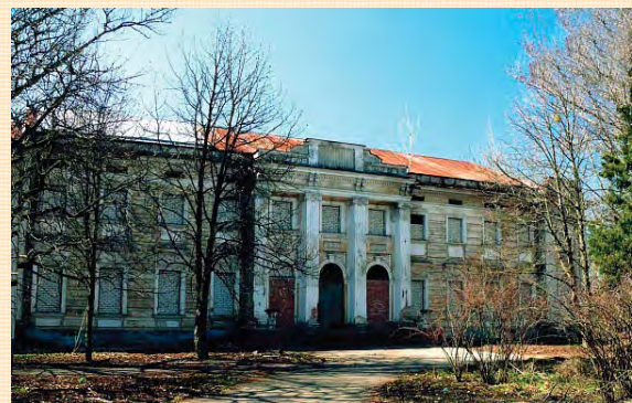
Старий Мерчик. Палац. Головний фасад.

За інформацією одного з путівників, тут мав бути дитячий будинок. Але дитячих голосів ми не почули. У кількох сотнях метрів від палацу, на шляху до церкви, розташований ще давніший службовий корпус, що на фотографіях мав досить пристойний вигляд. Але коли під'їхали ближче, то побачили тільки руїни, що залишилися після пожежі, яка сталася років п'ять тому.