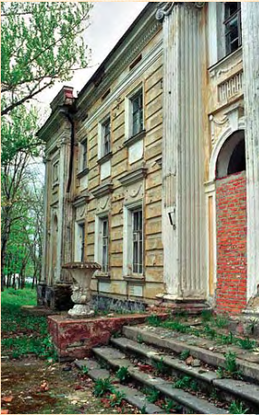
Старий Мерчик. Скрізь запустіння й байдужість.