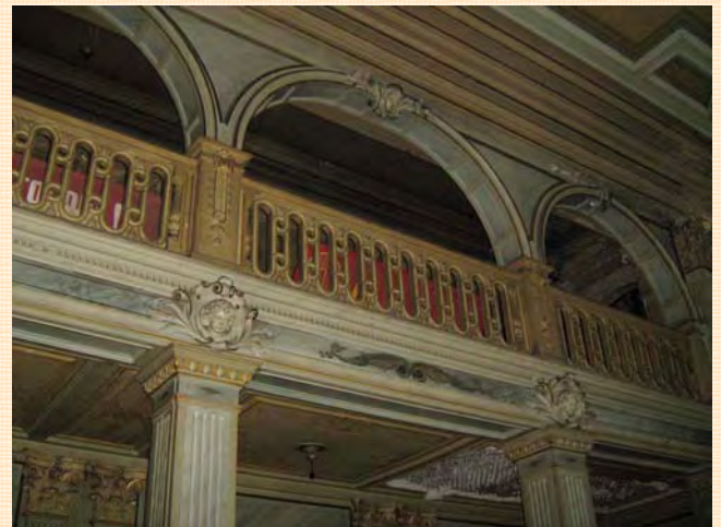
Палац у Шарівці. Інтер'єр зали.

Зі слів охоронців дізнаємося, що садиба заснована осавулом Охтирського полку Шарієм на отриманих від Петра I землях. У 1890 році маєток придбав відомий промисловець Леопольд Кеніг, який і збудував із розмахом розкішний палацовий комплекс, включивши до нього вже існуючу будівлю. У приміщеннях палацу досить добре збереглися розкішні