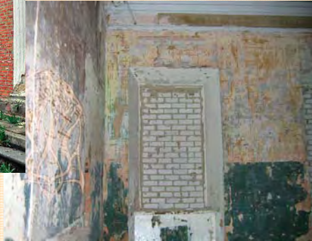
Старий Мерчик. Одна з кімнат палацу.

Здається, час тут зупинився. Не менш гнітюче вра-