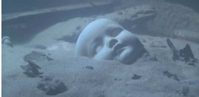
Серед уламків на дні

скелети людей, але їх не було. „Сильне враження справила лежача на ґрунті фарфорова голова ляльки без волосся, без тулуба. Чи врятувалася дівчинка – господарка ляльки або пішла на дно, у відчаї притискуючи її до груді?... Багато хвилювань відчули дослідники, побачивши декілька пар взуття. Ліві і праві черевики і туфлі точно відповідали один одному, і створилося враження, що вони були на ногах людей, які потонули. Тіла були знищені, з'їдені мешканцями моря, зруйновані солоною водою, а взуття – це єдине, що від них залишилося.