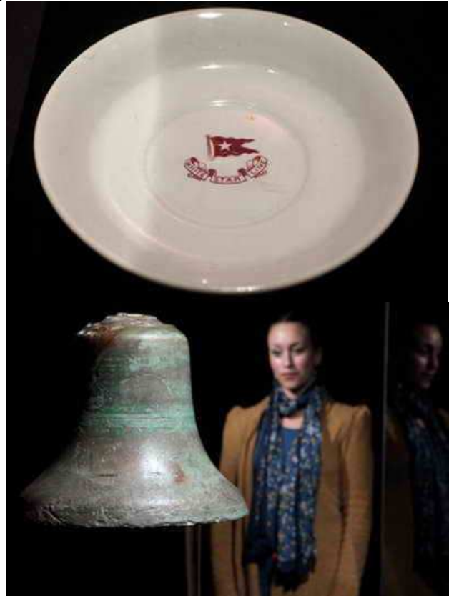
Експонати лондонської експозиції „Тітанік: Виставка артефактів”

У 2006 році США, Канада, Великобританія і Франція оголосили про намір укласти угоду про охорону „Тітаніка” від любителів старовин. У тому ж році корпорацію Дж. Туллока остаточно позбавили права власності на підняті з „Тітаніка” речі. Федеральний суд США оголосив фірму тимчасовим хранителем речей, який володіє правом демонстрації, але не продажі колекції.