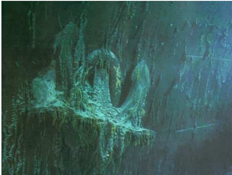
Якір у клюзі

Судно знаходиться у досить поганому стані. Його борти покриті іржею, що утворила величезні нарости. Як з'ясували пізніше, це була робота маловідомих бактерій, для яких метал є джерелом живлення. Значно постраждали й дерев'яні частини, зокрема, дошки палуби, збереглися лише поодинокі деталі з дуба.