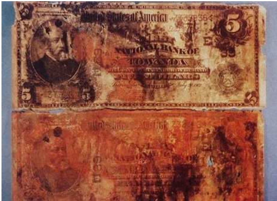
Підняті з „Тітаніка” артефакти експонувались на виставці в Сан-Франциско 6 червня 2006 року

У листопаді 1991 року на Вченій раді Інституту океанології ім. П.П.Ширшова Російської Академії наук А.М.Сагалевич звітував про роботу радянської (далі – російської) підводної експедиції. Дослідницьке судно „Академік Мстислав Келдиш” із двома глибоководними апаратами „МИР” протягом 19 днів працювало над залишками „Тітаніка”. В роботі експедиції брали участь представники канадської фірми IMAH, американської фірми OCEAN IMAGE і Національного географічного товариства США. Відбулося 17 занурень „МИРів”, під час 15 з них проводилися відеозйомки, за результатами яких потім були змонтовані декілька одногодинних фільмів. Були отримані