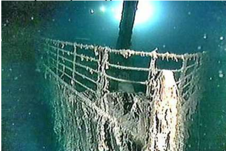
Нашарування на лєсах

14 липня занурення повторили. На цей раз огляд тривав майже три години. Але при підйомі „Елвіна” робот „Джейсон юніор” випав зі штатного місця і повис на кабелі. Хвили не дозволили водолазам повернути його, прийшлося підіймати „Елвіна” і робот окремо, обрубавши кабель.