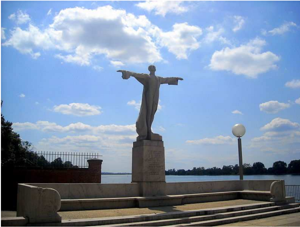
Меморіал „Тітаніку” у Вашингтоні.

Проте „РМС Тітанік Інкорпорейтед” не бажає втрачати прибуток. Компанія завчасно готується до столітнього ювілею трагедії. 5 листопада 2010 р. виставка артефактів з „Тітаніка” відкрилась у Лондоні. До квітня 2012 р. експозиція демонструється в Art Science Museum Сінгапура. 200 предметів з лайнера увійшли до колекції, що стане доступною для огляду у лютому 2012 року відвідувачам Музею природничої історії м. Сан-Дієго, Каліфорнія.