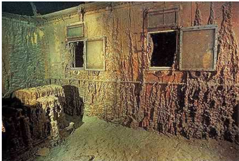
Офіцерські каюти на шлюпочній палубі

Судно знаходиться у досить поганому стані. Його борти покриті іржею, що утворила величезні нарости. Як з'ясували пізніше, це була робота маловідомих бактерій, для яких метал є джерелом живлення. Значно постраждали й дерев'яні частини, зокрема, дошки палуби, збереглися лише поодинокі деталі з дуба.