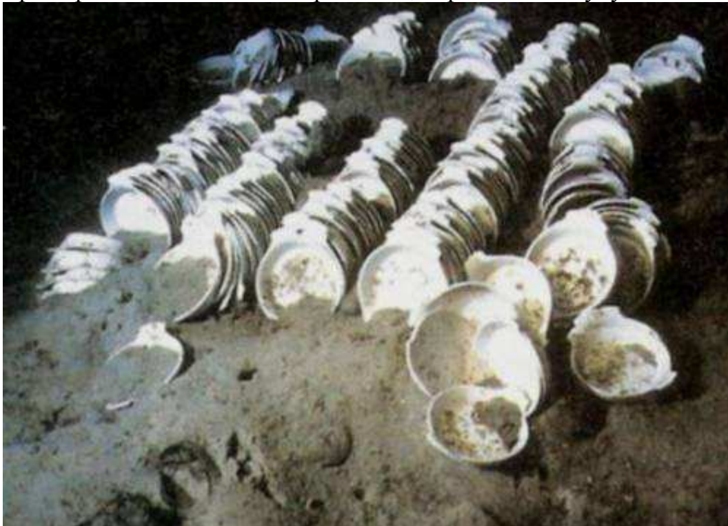
Посуд на дні

Одним з виконавців підйому артефактів з „Тітаніка” був Поль-Анрі Наркоме, досвідчений підводник, пілот мінісубмарини „Іфремера” з 1987 року. Саме йому належить відкриття ще одної частки корпусу „Тітаніка”, який, виявляється, розломився не на дві, а на три частини. П.-А. Наркоме займався тим, що за допомогою механічних маніпуляторів збирав зі дна артефакти та складав їх у металевий кошик на борту глибоководного апарата. Йому вдалося підняти, зокрема, декілька шкіряних валіз. За допомогою магнітної тарілки Поль Анрі Наркоме підняв безліч предметів, переважно посуду.