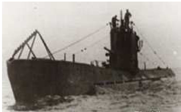
Підводний човен типу „М”.