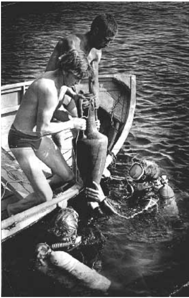
Аквалангисты ЭПАР поднимают амфору на Старом Днепре. 1970-е годы.

Запорожские аквалангисты активно участвовали в 1966-1969 годах в экспериментах с первыми советскими подводными обитаемыми домами в Черном море, организованными донецким клубом «Ихтиандр», о чем шла речь в предыдущем номере журнала [1]. Одновременно они организовывают своими силами подводные археологические разведки в Черном море. Особенно результативной была разведка 1968 года, когда на дне бухты Новый Свет неподалеку от г. Судака были обнаружены большие скопления керамической посуды X-XV веков. Тогда же совместно с Запорожским краеведческим музеем клубом «Скиф» были организованы экспедиции по изучению состояния и сбору образцов флоры и фауны Азовского моря.