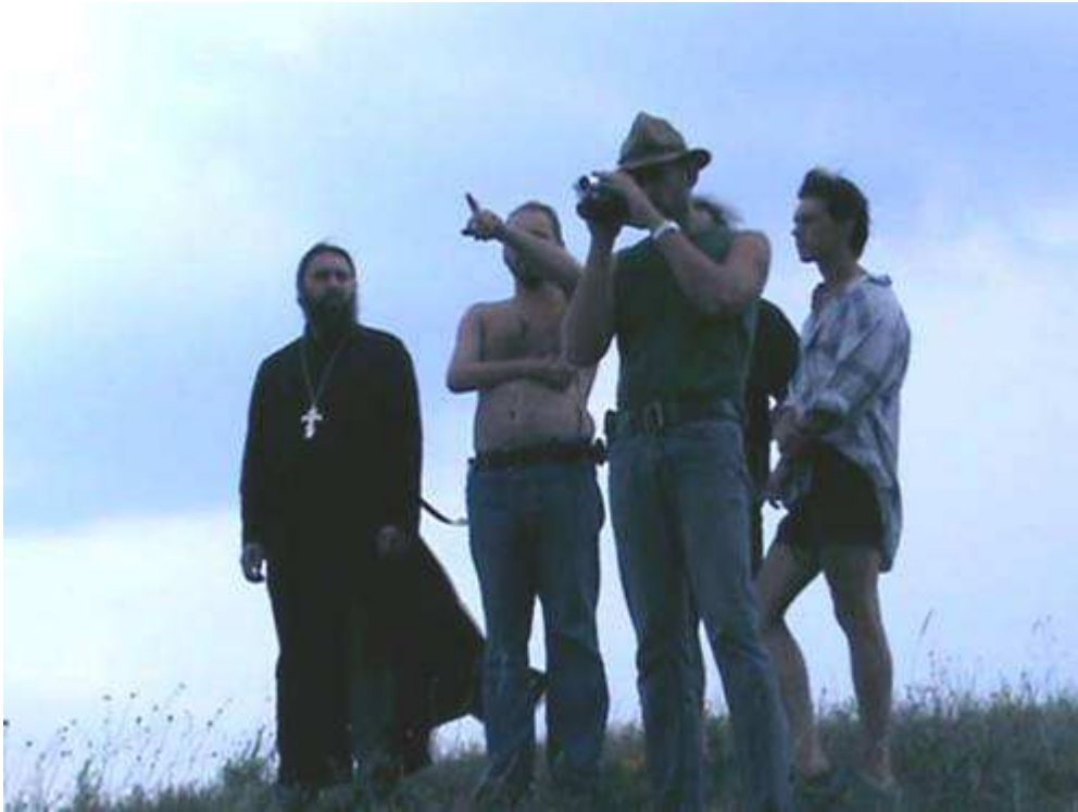
Фото 8. Огляд місця бою біля Кривої Луки

засідку, використовуючи рельєф місцевості та побудувавши редути. Повстанці проривалися на Дон - до К.Булавіна. Йшли кінним порядком та по річці на стругах.