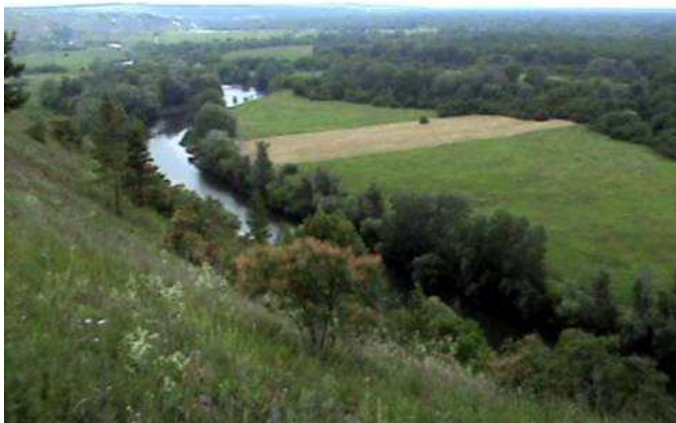
Фото 7. Сіверський Донець біля Кривої Луки

Першими на місце прибули царські війська, які встановили артилерійські батареї, очікуючи просування козаків саме цим шляхом. Інакше кажучи, бригадир Шидловський організував