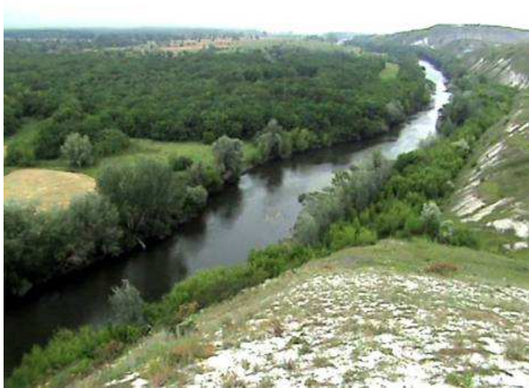
Фото 9. Сіверський Донець біля Кривої Луки