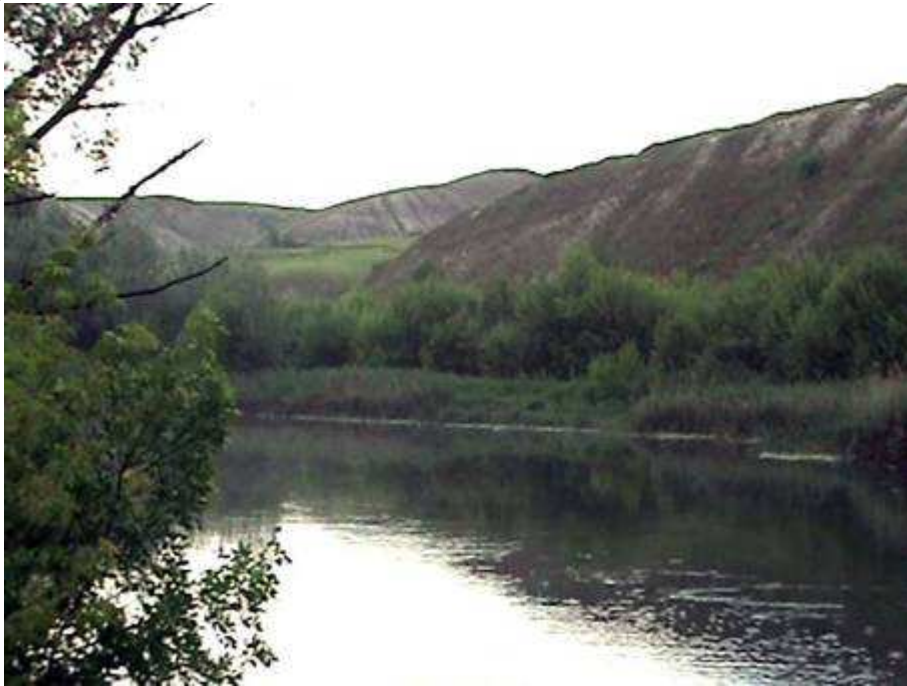
Фото 15. Крива Лука

Похід Семена Драного на Сіверський Донець взагалі був чи не найрішучою та послідовною дією повстанців. Схоже, що С.Драний очолював радикальні кола козацької голоти. Донський козак із Старо-Айдарського містечка, він був обраний отаманом. Вже після придушення повстанців, під час слідства та допита полонених козаків чимало з них посилалися на Драного як на ініціатора – „луцшого заводчика” повстання, який підбурював до бунту самого К.Булавина.