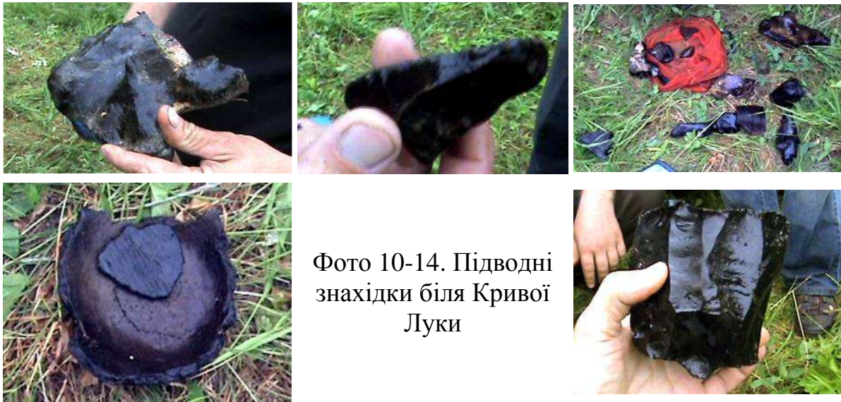
Фото 10-14. Підводні знахідки біля Кривої Луки

цілою торбиною знахідок. Розкладаємо їх на траві, розглядаємо та обговорюємо.