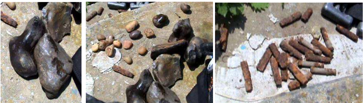
Фото 4-6. Підводні знахідки: кремень та залізо

Знов піднявся на беріг, знов пробирався через ліс, потім все ж таки знайшов стежку і вийшов до бази. Дмитро Гришко вже був тут, і мені залишалося лише відчищати свій гідрокостюм на пляжі. Попри всі мої очікування, Валерій Нефьодов залишився задоволений дайвом у Сіверському Донці. Він підняв чимало кременя – як природного так і обробленого людиною, були й інші знахідки, але стосовно XVIII століття й булавінського повстання – нічого.