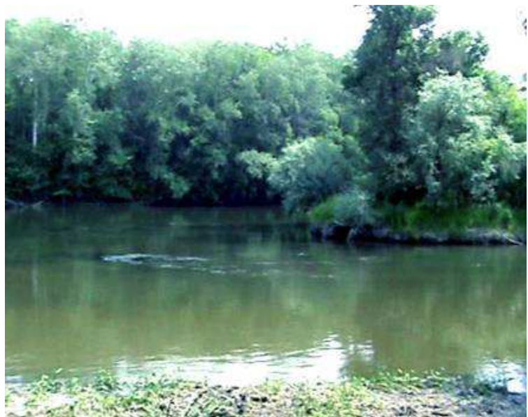
Фото 3. Безим'яний острів на Сіверському Донці, біля якого шукали козацькі човни