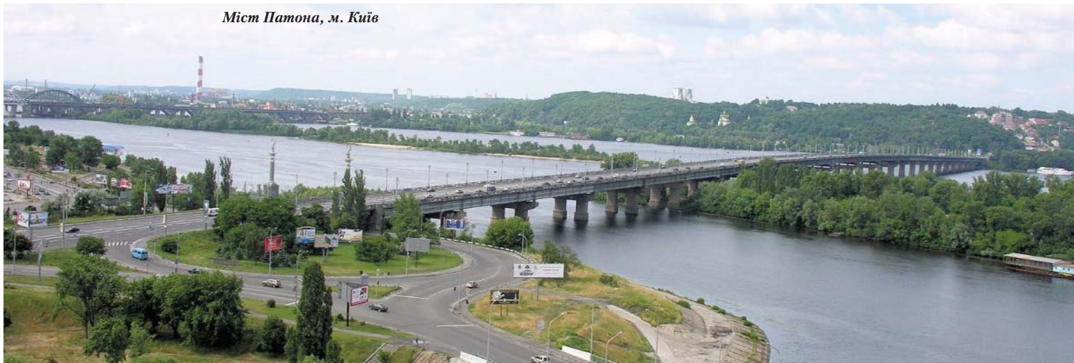
Міст Патона, м. Київ

Разом із науково-дослідним і проектним інститутом "Укрпроектстальконструкція" створено проекти та розроблено нові технології