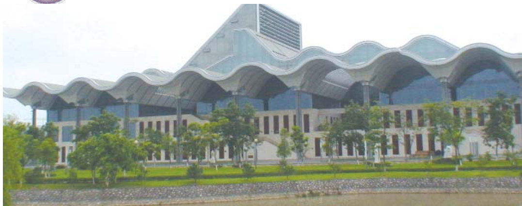
Национальный Центр Конгрессов (НСС) в Ханое – место проведения ежегодного Собрания Международной комиссии по большим плотинам в 2010 г.

тинам" осуществляет свою деятельность в рамках законодательства Украины. Центральным Уставным органом управления Комитета является Общее собрание членов Комитета, постоянно действующим коллегиальным органом, осуществляющим руководство текущей деятельностью Комитета является его Президиум. Текущую деятельность осуществляет