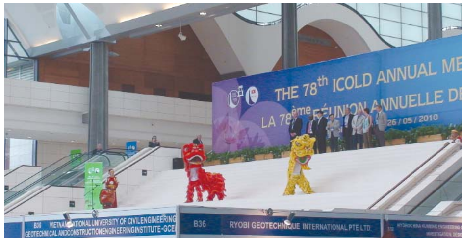
Торжественное открытие Собрания ICOLD

В первые годы создания цель ICOLD состояла в поощрении дости-