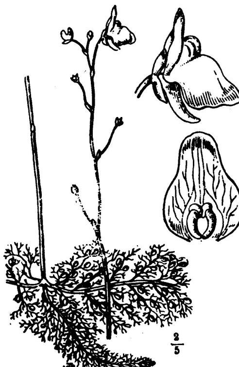
Рис. 1. Загальний вигляд Utricularia australis R. Br. Fig. 1. General view Utricularia australis R. Br.

Світловий мікроскоп. Пилкові зерна 12—15-борозно-злітоорові, сплющено-сфероїдальні, в обрисі з полюса 12—15-лопатеві, з екватора широкоеліптичні, в екваторіальній зоні роздуті. Полярна вісь 29,3—42,6 мкм, екваторіальний діаметр 30,6—42,6 мкм. Борозни завширшки 1,1—2,0 мкм, довгі, з рівними краями, борозна мембрана згладжена. Орі слабопомітні, дещо екваторіально витягнуті, округлопрямокутні, утворюють на екваторі оровий пояс.