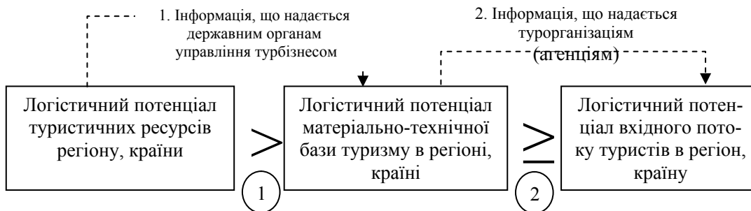
Рис. 1. Логістична модель сталого розвитку туристичного бізнесу в регіоні, країні

Таким чином, пропонується наступна логістична модель туристичного бізнесу, яка забезпечує його сталий розвиток в регіоні, країні (рис.1.). У цій моделі перше співвідношення виступає запобіжником першого рівня щодо збереження туристичних ресурсів регіону, країни, а друге – окрім того, що виступає запобіжником другого рівня, ще й забезпечує бізнесову ефективність використання туристичних ресурсів регіону, країни. Інформаційні потоки в даній моделі теж бувають двох видів: перший вид – це інформація щодо проектного потоку туристів, що надається державним органам управління туризмом (можливо, її слід вказувати в рекреаційному паспорті ресурсу (об'єкту)); другий вид – це інформація, яка надається туроператорами (які звичайно володіють матеріально-технічною базою туризму в регіонах) фірмам – турагенціям – скільки і яких путівок пропонується на продаж.