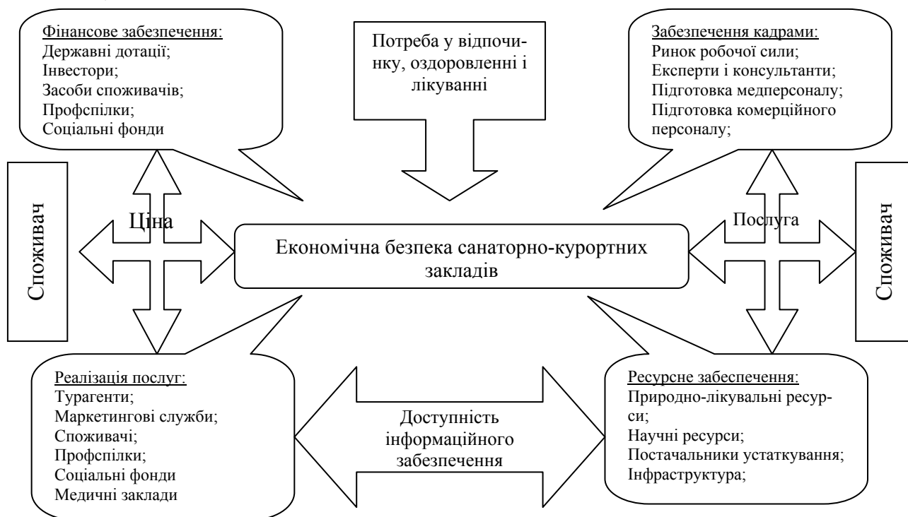
Схема. Забезпечення фактичної економічної безпеки регіон

Суб'єктами кадрового забезпечення являються: