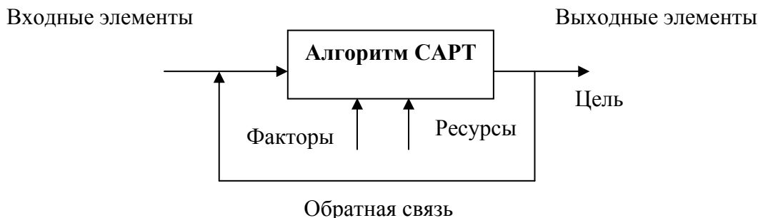
Рис. 1. Модель процесса сегментного анализа рынка (САРТ)

цесс САРТ в виде простейшей системы управления, состоящей из отдельных элементов, их взаимосвязей и факторов влияния, модель которой представлена на рисунке 1. Эффективность использования принципа системности в процессе САРТ заключается в том, что он обеспечивает поиск и систематизацию множества альтернативных решений при определении глубины анализа, выборе критериев сегментирования; выделении сегментов, анализе свойств выделенных сегментов, построении модели сегментной структуры рынка, последующем выборе наиболее привлекательного сегмента в качестве целевого и др.