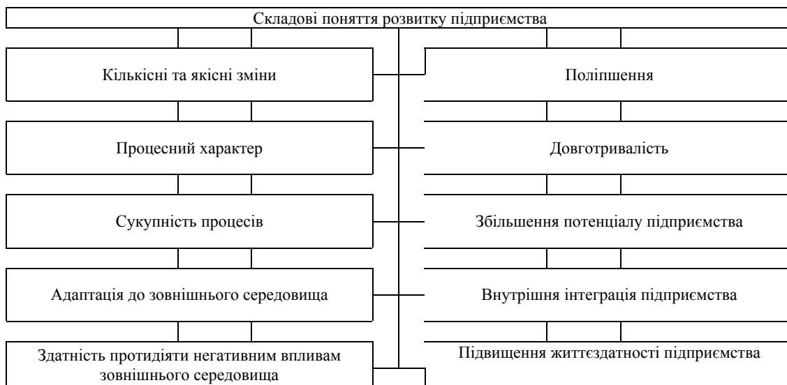
Рис. 2. Складові визначення розвитку підприємства

Представляється можливим стверджувати, що домінантою понять організаційного розвитку, керованого розвитку та сталого розвитку є все ж таки єдине поняття розвитку підприємства, яке, незважаючи на наявність певних точок зору щодо його розуміння, а може й завдяки їй, зважаючи на різність висловлених точок зору, потребує певної конкретизації, яку пропонується здійснювати із використанням контент-аналізу. Аналіз існуючих точок зору щодо розуміння сутності розвитку взагалі та суто розвитку підприємства [4,8,11,12,15,16,18,23,24] дозволив виділити елементи або складові визначення розвитку підприємства. Вони представлені на рис. 2. Варто зазначити, що, мабуть, складові розвитку мають різну вагомість у його визначенні та визнанні, але це питання потребує додаткового дослідження, і тому для першого наближення у розумінні поняття розвитку пропонується обмежитися простим їхнім перерахуванням, яке дозволить уточнити і конкретизувати поняття розвитку підприємства.