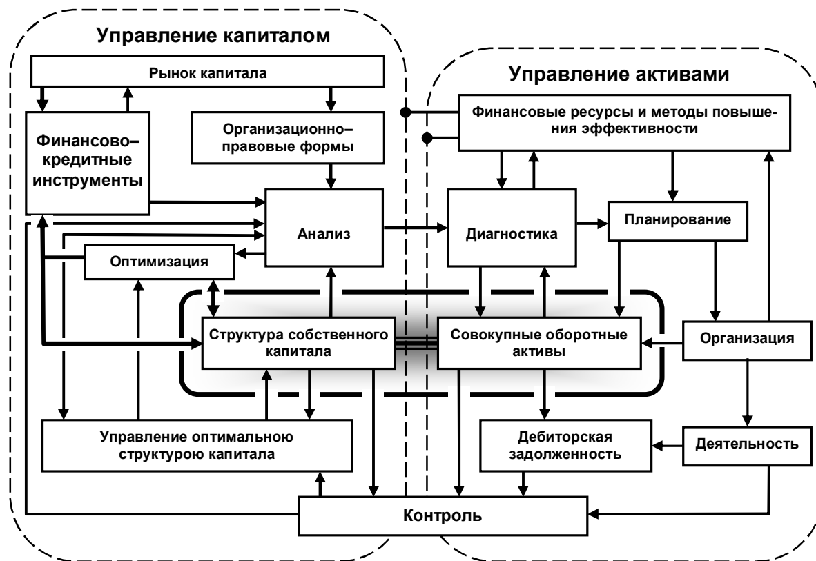
Рис. 3. Механизм финансового управления с использованием оптимизации собственного капитала и оборотности совокупных активов

банковской системы, отсутствия эффективного фондового рынка и реальных инвестиционных потоков эффективность деятельности и развитие корпоративных предприятий в современных рыночных условиях Украины, возможно, связывать только с оптимальным использованием собственных ресурсов предприятий. Модель такого механизма управления подана на рис. 3.