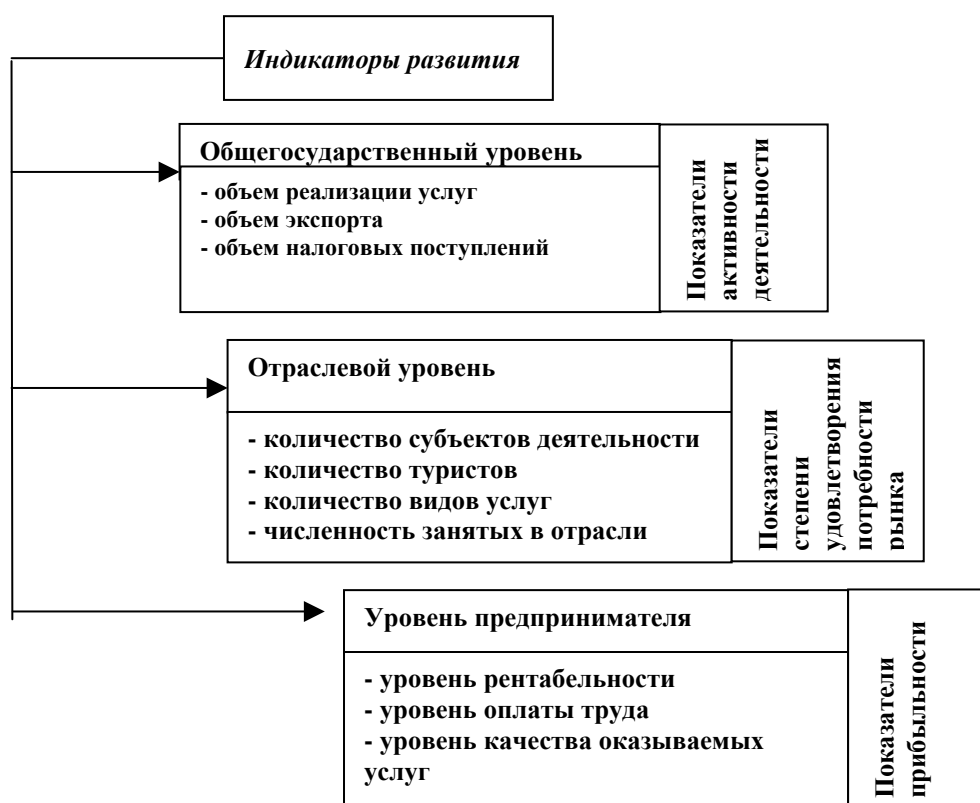
Рис. 1. Система индикаторов развития туризма

На основе принципов системного подхода показатели эффективности туристической деятельности должны отражать уровни получения результатов. В этом случае обеспечивается целостность системы показателей, учитывающей взаимосвязи исследуемого объекта и окружения. И поэтому можно предложить систему показателей-индикаторов для оценки развития предпринимательской деятельности в туризме, к тому же сформированную по соответствующим уровням (рис. 1).