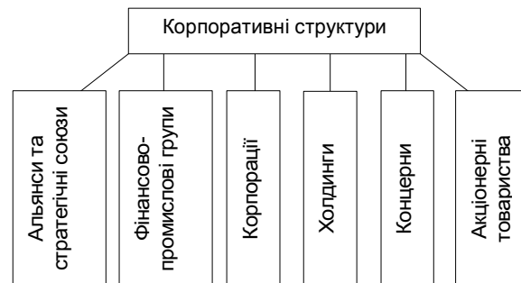
Рис. 3. Види корпоративних організацій.

Зараз у багатьох країнах світу функціонують крупні корпоративні структури. У їх основі лежить принцип об'єднання - власності, ресурсів, сфер діяльності. Конкретні форми господарських об'єднань різноманітні й залежать від національної специфіки (рис. 3).