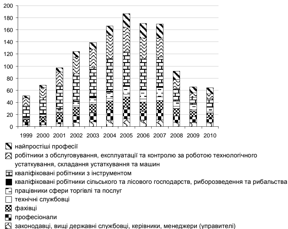
Рис. 2. Динаміка потреби підприємств у працівниках за професійними групами в 1999-2010 рр., тис. осіб [3].

Позитивні зрушення в професійних розподілах відбулись і на українському ринку праці (рис. 2). Так, більш затребуваною стала праця кваліфікованих робітників з інструментами, яка зберігала позитивну тенденцію до 2006 року. Радіє те, що знижується кількість працівників найпростіших професій, тоді як більшим попитом починають користуватись фахівці й професіонали. В останнє десятиліття значну части-