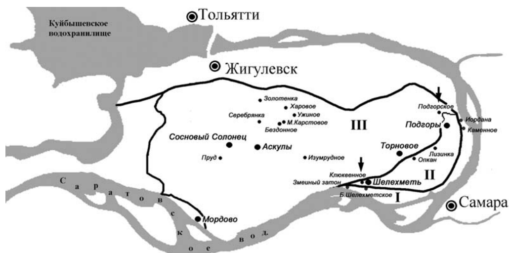
Рис. 1. Схема района исследований: I — пойма; II — надпойменная терраса; III — карстовая возвышенность. Местонахождения сукторий обозначены стрелками.

Fig. 1. Map of the investigated region: I — flood plane; II — a terrace above flood plane; III — karst height. The suctorian ciliates locations are marked by arrows.