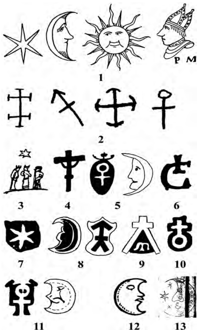
Таблиця 2. Клейма зброярів із зображенням сакральної символіки. 1. Петер Муніх (Peter Munich) старший та молодший, династія клинкових майстрів. Золінген, друга половина XVI — друга половина XVII ст.; 2. Конрад Польс (Conrad Pöls, Pauls). Золінген, 1594–1605; 3. Віллемс Пауль. Золінген, 1640–1670; 4. Генріх Коль старший. Золінген, 1560–1620; 5. Клеменс Стамм. Золінген, кінець XVI ст.; 6. Невідомий майстер з виготовлення стволів. Аугсбург, кінець XVI ст.; 7. Крістіан Спор (Christian Spor), майстер з виготовлення обладунків. Інсбрук, 1464–1485; 8. Ганс Салінген (Salingen). Гамбург, початок XVII ст. Поряд, ймовірно, клеймо поліру-