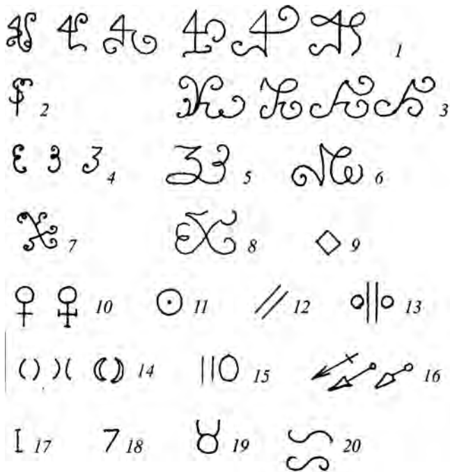
Таблиця 1. Знаки, зафіксовані на французьких клинках 18–19 ст.:

1 — астрологічний знак Юпітера, алхімічний відповідник олова; третій знак зліва може означати лужне середовище; 2 — астрологічний знак Сатурну, алхімічний відповідник свинцю; 3 — літера «К», від «Кабала» (ймовірніше, перший символ ліворуч — комбінація знаків стихії Вогню — Овна та Лева, праворуч — зодіакальні знаки Козерога, алхімічний відповідник процесів ферментації); 4 — випалена мідь, літера «Е», або цифра «3»; чотири такі символи означали процес фільтрації; 5 — теж саме, що й (4), в іншому написанні; 6 — не визначено; 7 — свинець (?); 8 — Меркурій (частина жезлу) — алхімічний відповідник ртуті, або зодіакальний знак Діви, алхімічний відповідник процесу дистиляції, або алхімічний знак «питного золота», можливо сірки; 9 — сурма чи діамант (октаедр, астрологічний відповідник стихії повітря та перетину шляхів Марса й Землі); 10 — астрологічний знак Венери, алхімічний відповідник міді; 11 — астрологічний знак Сонця, або алхімічний знак золота (у розенкрейцерів також позначав імператорську владу), інше тлумачення — знак сірки; 12 — не визначено; 13 — мідний шафран чи зодіакальний знак Близнюків (?); 14 — астрологічний знак Місяця, або алхімічний знак срібла; 15 — число «110» (?); 16 — зодіакальний знак Стрільця (алхімічний відповідник процесів пом'якшення) та астрологічні символи Марсу (алхімічний відповідник заліза, нахил стрілки вліво-вниз — ошурки); 17 — символізує цифру «1»;