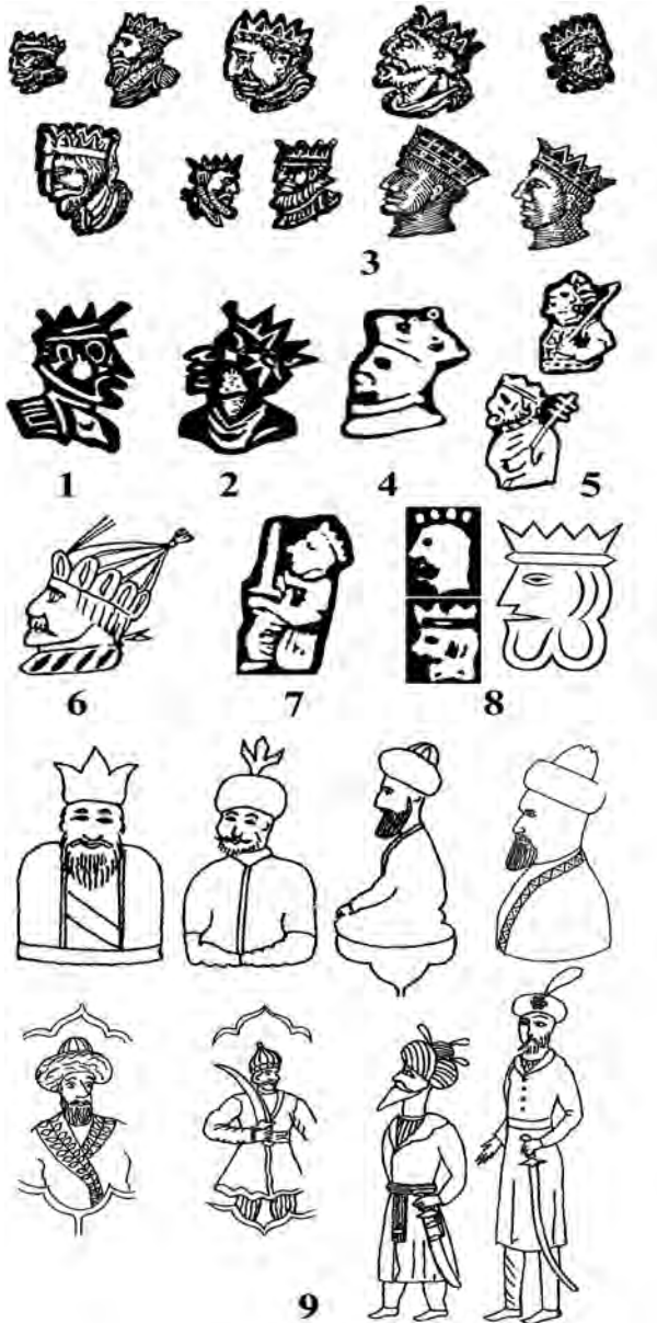
Таблиця 3. Клейма італійських та золінгенівських майстрів і зображення на кавказьких клинках вельможних осіб. 1. Невідомий майстер з виготовлення мечів. Італія, близько 1530 р. 2. Матінні Антанні

претаціями західноєвропейських клейм. Саме на Кавказі це зображення набуло найвищої популярності, ймовірно, як мусульманської альтернативи «християнському монарху» (Табл. 3, № 9).