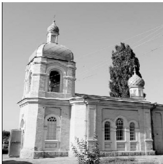
Миколаївська церква; ст. Миколаївська (PCO-A) (див.: Киреев Ф. Православная Осетия. Станичные храмы Осетии. Станица Николаевская. – Режим доступа: http://www.blagos.ru/newspaper/pdf/69.pdf )