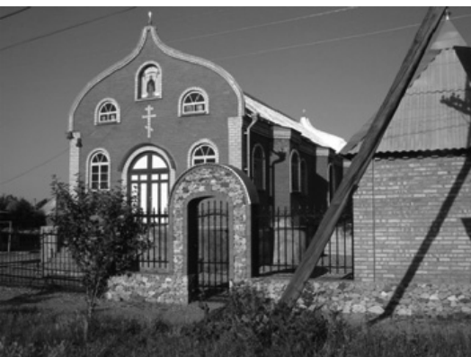
Новий храм Покрови Пресвятої Богородиці; ст. Котлярівська (КБР).