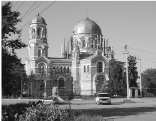
Храм св. Архистратига Михаїла Архангела; м. Майський (колишня ст. Пришибська).

ли. У 1877 р. жителі ст. Прохладній ухвалили «громадський вирок» про спорудження кам'яної церкви на місці згорілої. Від місцевих торговців і жителів щорічно поступало до фонду громадського капіталу 2000 рублів пожертвувань, які відразу зараховувалися до суми, призначеної для будівництва церкви. Таким чином, населення зібрало для зведення храму 60 тис. рублів 30 . У 1883 р. розпочато будівництво нової церкви св. Миколи Чудотворця за проектом архітектора Терської області Михайла Адамовича Сурмієвича. Церква була освячена 6 грудня