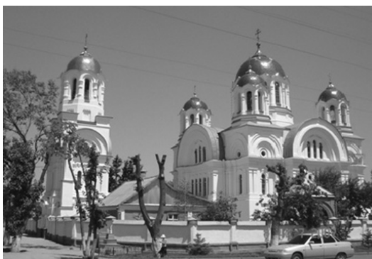
Свято-Микільський храм; м. Прохладний (КБР).

Станиця Павлодольська заснована в 1787 р. казенними селянами Харківської губернії в числі 1030 душ чоловічої поли. У 1848 р. поселена 204 душами чоловічої статі з Харківської губернії 42 .