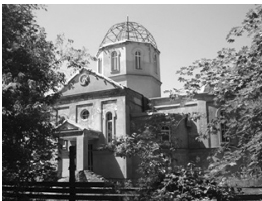
Нова церква у ст. Архонській (PCO-A).

Більшість сімей переселенців походили з одних і тих же селищ і були один одному родичами. Так, з Кременчуцького повіту, Мозолівській волості вели родовід 6 сімей Мальків. З того ж селища приїхали 4 сім'ї Коваленків і по 3 сім'ї, які мали прізвища Рожко і Чуйко. З того ж повіту і волості, але с. Жуковки – 3 родини Ступаків. У справі міститься листування із Ставропольською казенною палатою, в результаті якої козаки, що подавали прохання, були зараховані від 10 березня 1898 р. до селянства новоутвореного селища Кременчук-Костянтинівського . Церква