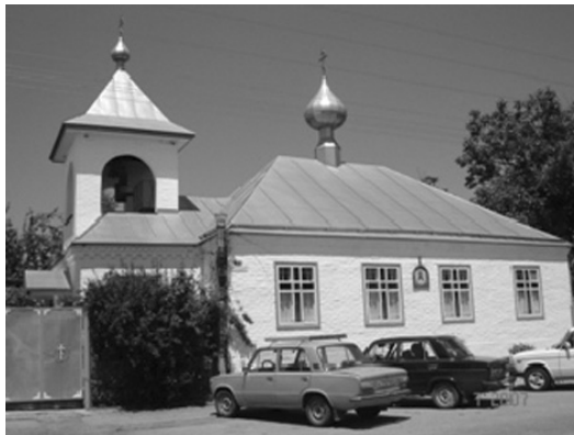
Свято-Володимирський храм; с. Ново-Полтавське (КБР).