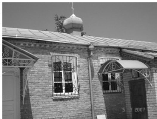
Храм св. Благовірного Олександра Невського; ст. Архонська (РСО-А).

Будівля зведена у вигляді хреста, а в західній частині влаштована дзвіниця. У 1897 р. в м. Владикавказі проживало 2162 українських переселенців 64 . У 1920-х роках ікони і фрески були знищені, а будівля збереглася. Церква відновлена в 1993 р. і освячена митрополитом Ставропольським і Бакинським Гедеоном.