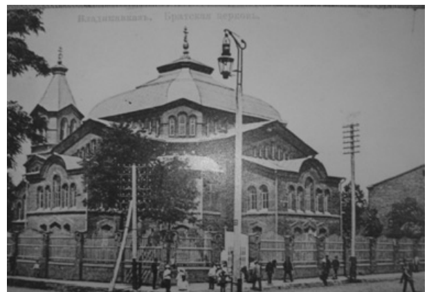
Братська церква в м. Владикавказі.