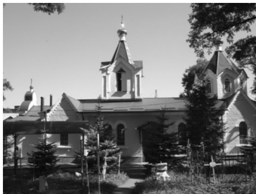
Храм Святого Пророка Божого Іллі; м. Владикавказ (РСО-А).

він був розібраний на цеглу, для будівництва нової школи. За словами отця Сергія (Шевченка) церква була спочатку підірвана. Новий храм Покрови