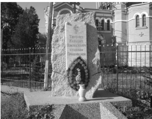
Пам'ятник терським козакам, засновникам ст. Пришибської; м. Майський (колишня ст. Пришибська).