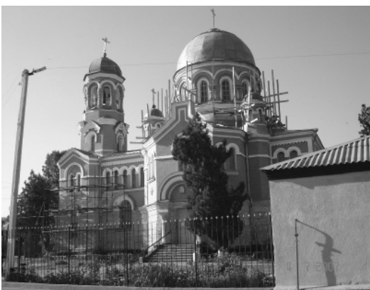
Храм св. Архистратига Михаїла; м. Майський (колишня ст. Пришибська).