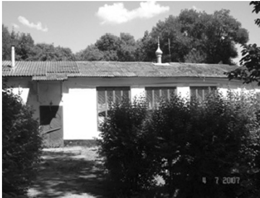
Церква в с. Кременчук-Костянтинівському (КБР).

У містах, колишніх козацьких станицях і селищах, де живе багато прихожан, храми, як правило, відновлені, відреставровані, або ж побудовані заново. Тут вони кам'яні, або цегляні, великі, просторі з дорожми іконостасами і куполами. У маленьких же селах нерідко церков немає взагалі, як наприклад в с. Чернігівському, а в інших – вони тягнуть жалюгідне існування. Проте, можна говорити, що роль православної церкви в громадському і духовному житті слов'янського населення на Терекі з кожним роком зростає. На сьогодні діяльність російської православної церкви спрямована також на підтримку мирного життя, стабільності,