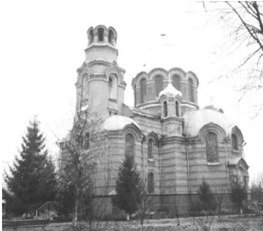
Свято-Георгіївський храм у м. Ардон (PCO-A)

стара церква була підірвана в період переслідувань на священнослужителів і віруючих. Новий