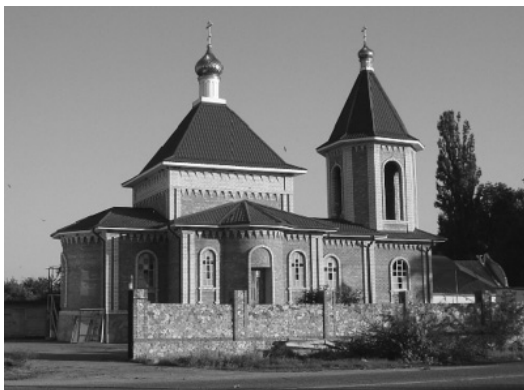
Храм св. Благовірного Олександра Невського; ст. Олександрівська (КБР).