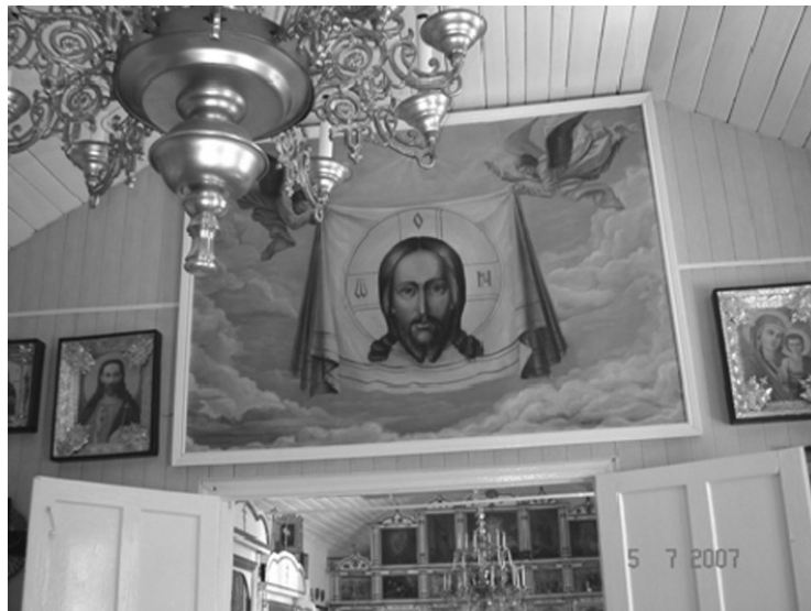
Внутрішнє убранство храму св. Благовірного Олександра Невського; ст. Архонська (РСО-А).