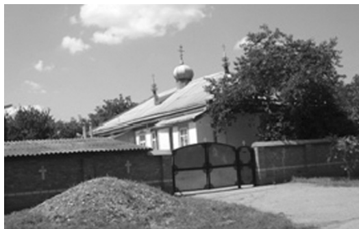
Церква Архистратига Божого Михаїла, ст. Солдатська (КБР).