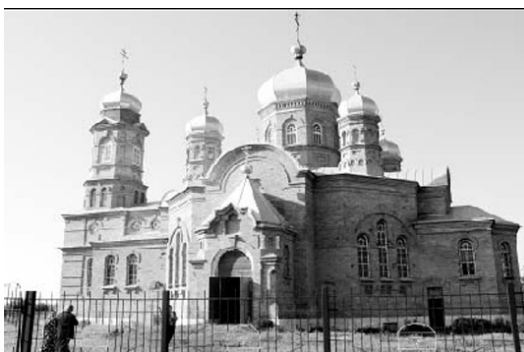
Храм Спаса Нерукотворного ст. Павлодольської (PCO-A) (див.: Киреев Ф. Православная Осетия. Станичные храмы Осетии. Станица Ардонская. – Режим доступа: http://www.blagos.ru/newspaper/pdf/69.pdf )