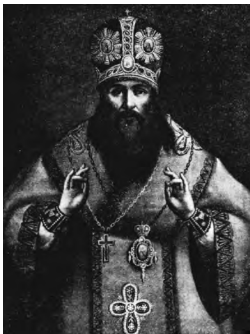
Архімандрит Іринеї Фальковський