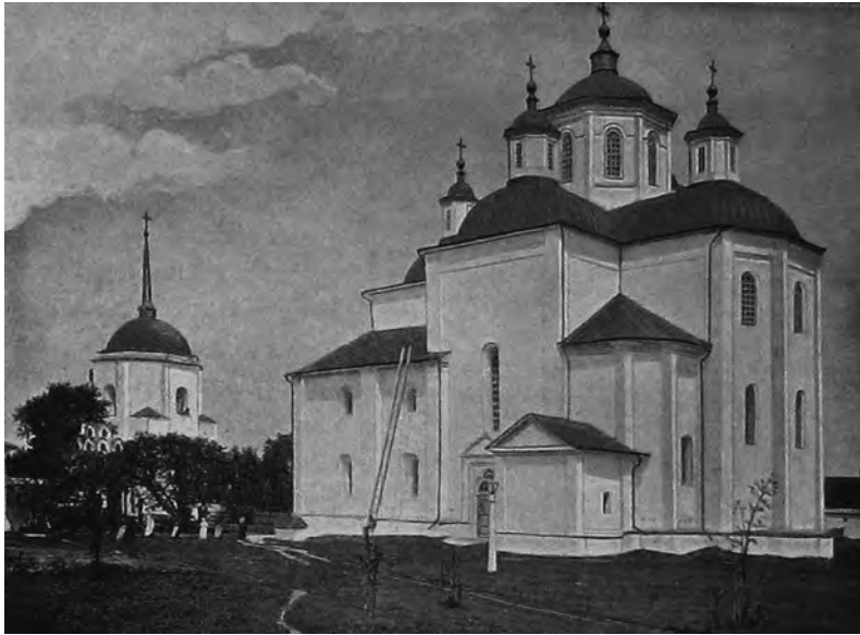
Собор Різдва Пресвятої Богородиці. Зліва надбрамна башта