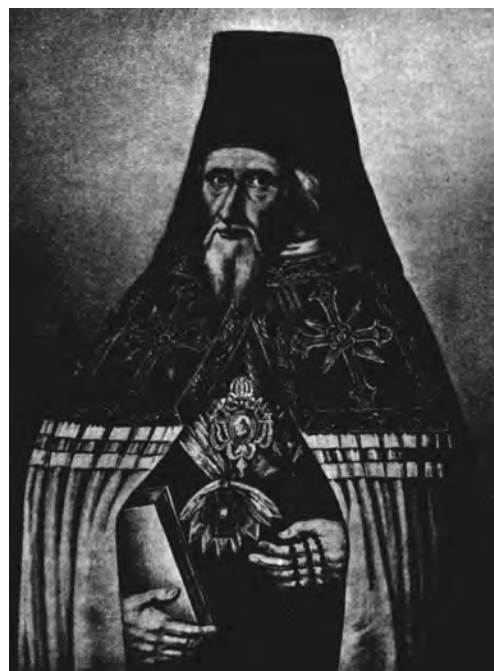
Архімандрит Феоктист Мочульський