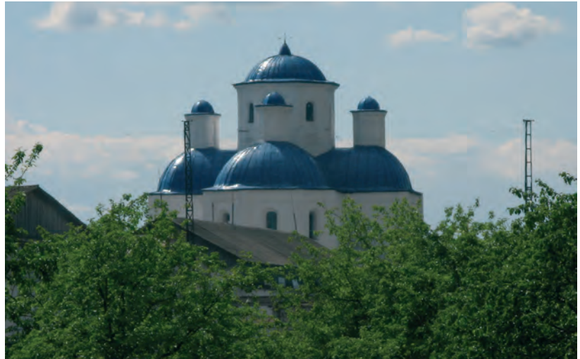
Собор Різдва Пресвятої богородиці (сучасний вигляд)