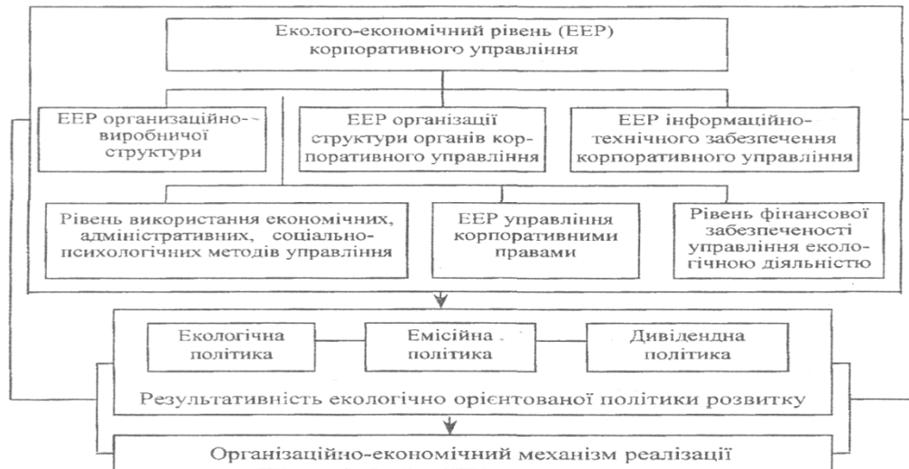
Рис. 3. Складові системи еколого-економічного рівня регіонального управління у взаємозв'язку з напрямками екологічної політики компанії