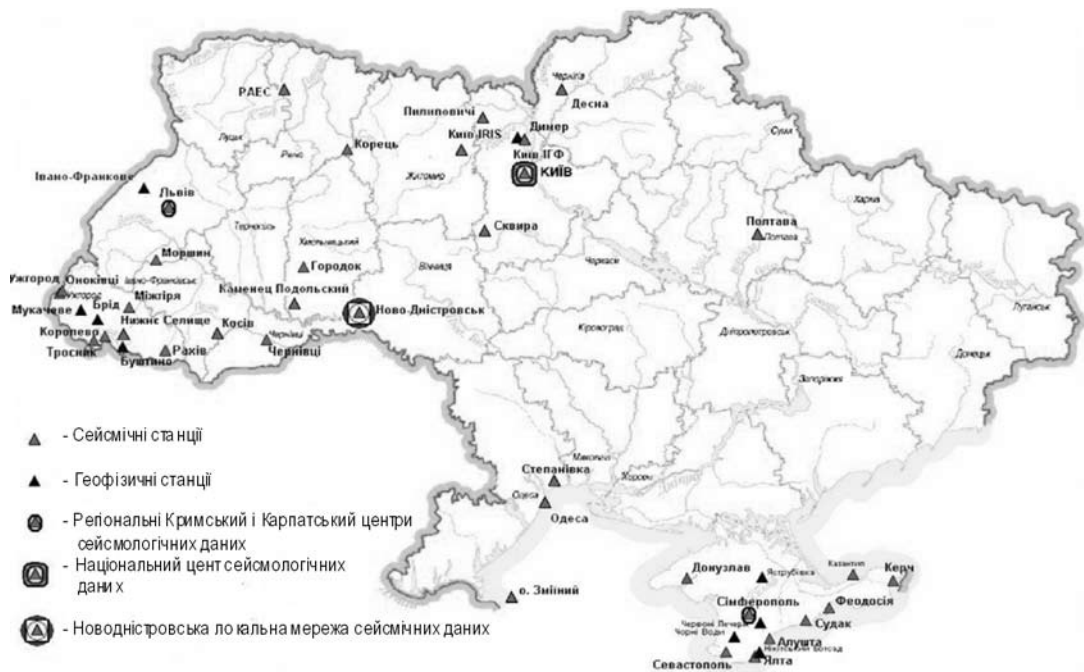
Рис. 3. Мережа сейсмічних і геофізичних станцій НАН України станом на січень 2009 р

Важливою ланкою системи сейсмологічного моніторингу є створений в ІГФ НАН України Національний центр сейсмологічних даних (НЦСД). НЦСД здійснює збір і накопичення сейсмологічної інформації, виконує оперативну оцінку сейсмологічної обстановки у всіх регіонах України, дозволяє забезпечити сейсмологічними даними геофізичні дослідження внутрішньої будови Землі та роботи з сейсмічного захисту.