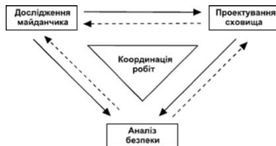
Рис. 1. Прямі (суцільні) і зворотні (пунктирні лінії) інформаційні зв'язки між роботами з дослідження майданчика, проектування і аналізу безпеки геологічного сховища [6].

Прямі і зворотні інформаційні зв'язки між пов'язаними видами діяльності наведено на рис. 1.