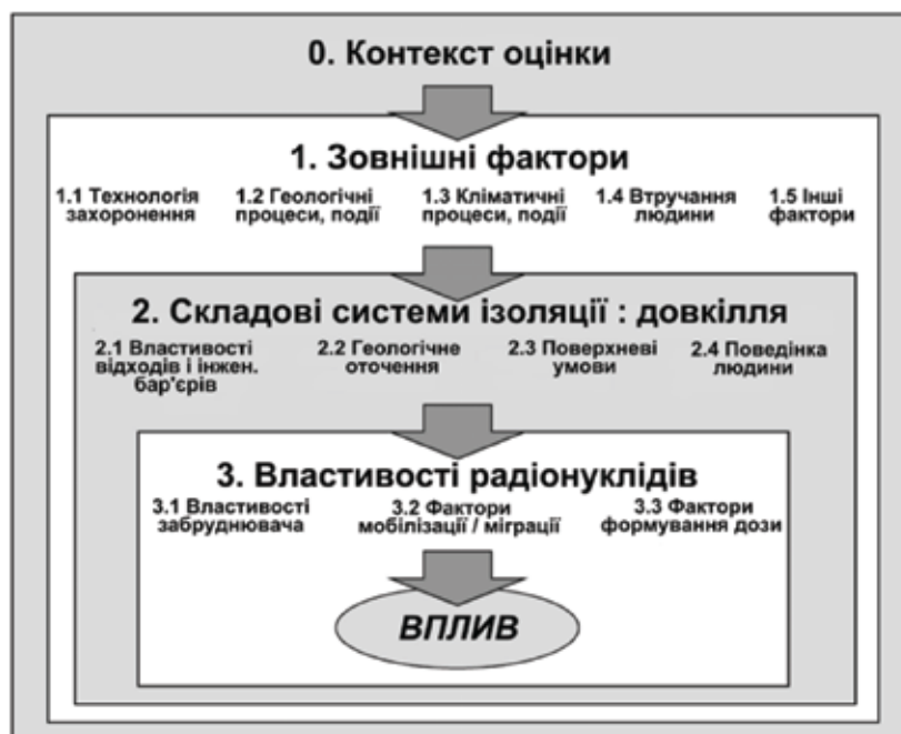
Рис. 2. Організаційна структура міжнародної бази даних властивостей, подій і процесів, що дозволяють оцінити безпеку систем геологічної ізоляції РАВ [8].

Важливим аспектом цієї бази даних є те, що вона включає нульову групу ВПП — «Контекст оцінки», де міститься перелік можливих кінцевих цілей виконання аналізу безпеки (оцінка доз; оцінка ризиків; оцінка концентрації радіонуклідів в біосфері, тощо). Саме попередньо вибрана кінцева мета і є визначальною для складу ВПП, що можуть сприяти її досягненню.