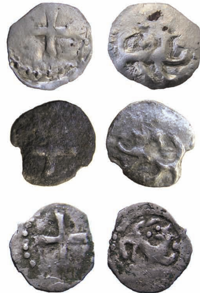
Монети Дмитра-Любарта Гедиміновича та Федора Любартовича, знайдені на території Волинської області (три типи)

Отже факт карбування у Луцьку срібних та золотих монет дає нам змогу стверджувати: грошовий ринок Волині відігравав значну роль у фінансовому житті Європи згаданого періоду. До списку монетарень України слід додати й луцький монетний двір, де карбувалися перші в Україні монети.