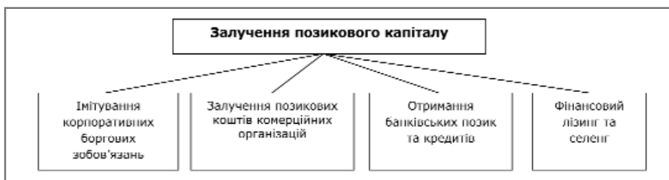
Рис 2. Фінансування позиковими коштами