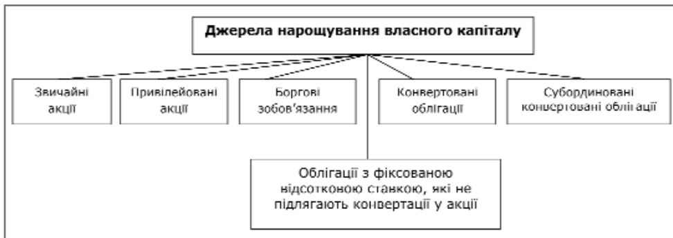
Рис 1. Джерела нарощування власного капіталу

У сучасних умовах кредити комерційних банків надаються для реальних проектів та таких, що швидко реалізуються із високою нормою прибутковості інвестицій. Залучення довгострокових