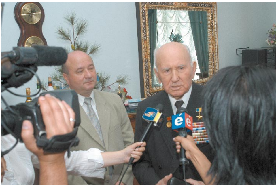
Спілкування з журналістами. 2005 р.