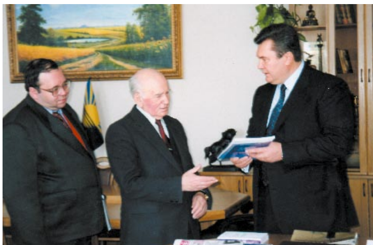
Дарунок Спільці краєзнавців України від голови Донецької обласної державної адміністрації В. Януковича. 2001 р.