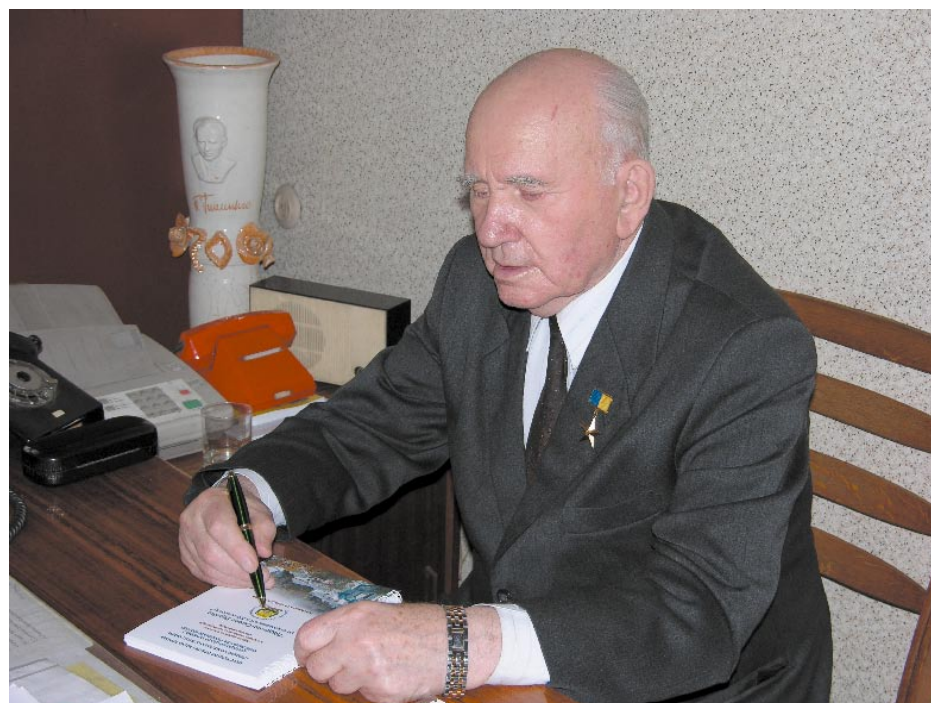
У робочому кабінеті