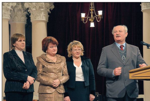
Вітання лауреата земляків із Крюківщини Чернігівської обл.