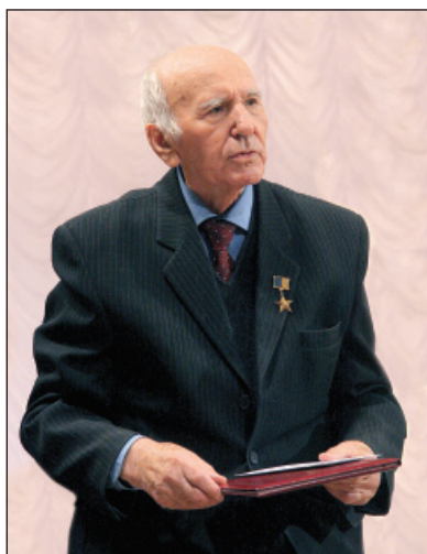
Голова Національної спілки краєзнавців України, академік П. Тронько