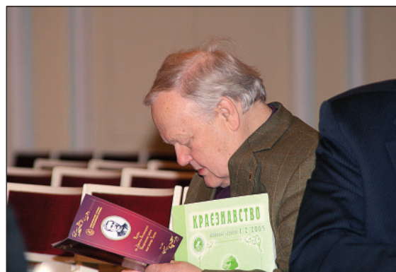
Голова Українського фонду культури, академік НАН України, поет Б. Олійник знайомиться з доробком краєзнавців