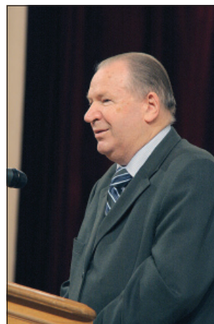
Директор Національної бібліотеки ім. В. Вернадського НАНУ, академік О. Онищенко