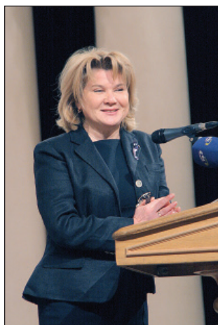
Директор Національної історичної бібліотеки України А. Скорохватава