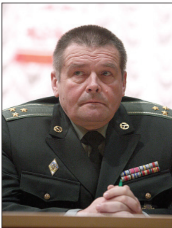
Командувач ракетних військ і артилерії Збройних сил України А. Колесніков