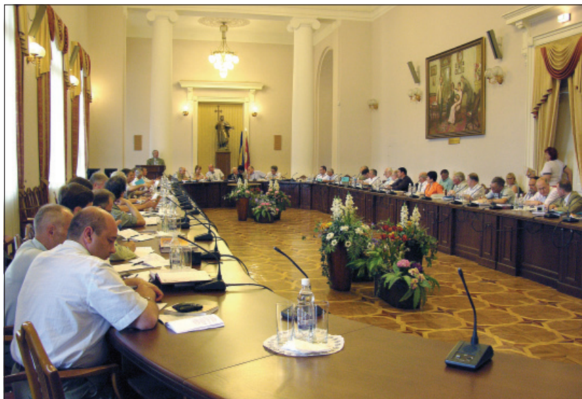
Засідання круглого столу з обговорення концепції нового енциклопедичного видання “Історія міст і сіл України”. Київський національний університет ім. Т. Шевченка, червень 2009 р.