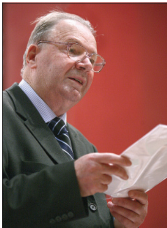
Академік — секретар відділення НАН України О. Онищенко