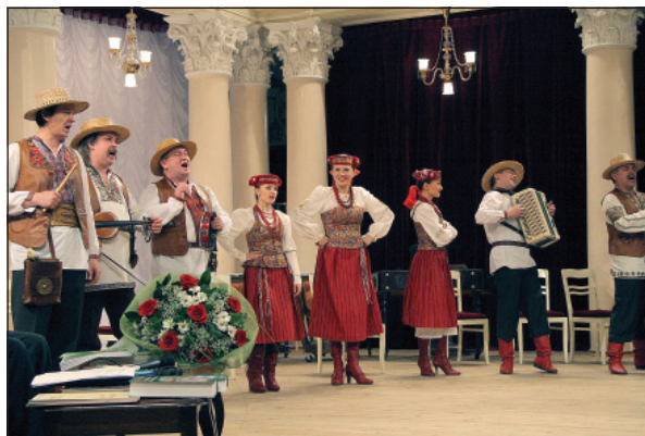
Вітання краєзнавцям митців