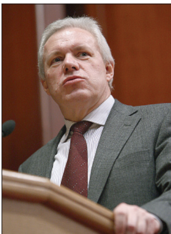
Голова Полтавської обласної державної адміністрації В. Асадчев