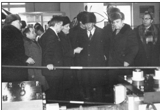
Photo 4. Academicians A. P. Aleksandrov and B. Ye. Paton in the laboratory for investigation of structural materials low-cycle fatigue. Explanations are given by the laboratory head Cand. Sci. (Eng.) K. B. Katsov.

Подальші дослідження показали (див. літ. у [10–15]), що інверсія масштабного ефекту в умовах корозійної втоми характерна для вуглецевих, низьколегованих сталей та алюмінієвих сплавів. Для високолегованих сталей і титанових сплавів у воді та водних розчинах солей її не виявлено. Зафіксовано тільки кількісні зміни у значеннях границі їх корозійної втоми. (Цей аспект проблеми ще залишається недостатньо вивченим, зокрема, для поверхнево зміцнених деталей, виробів з покриттями тощо).