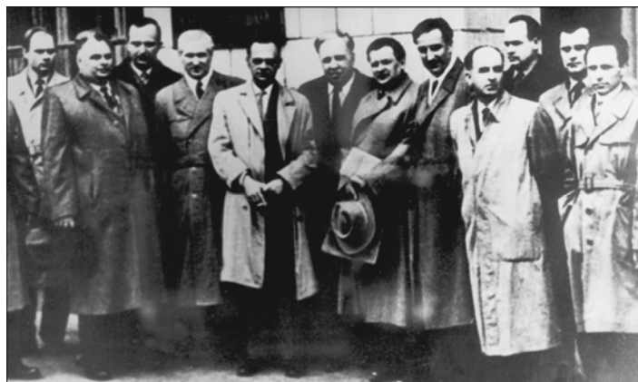
Фото 1. Наукова сесія з проблем ФХММ у Києві в 1963 році.

Починаючи з середини 50-х років, в Україні центром наукових і прикладних досліджень з проблеми ФХММ став ФМІ АН УРСР у Львові (до 1964 р. – Інститут машинознавства та автоматики). У тісній співпраці з Інститутом фізичної хімії АН СРСР (тут працювали П. О. Ребіндер, В. Й. Ліхтман та їх учні і співробітники, які підтримували наукові контакти з вченими ФМІ), Інститутом механіки АН УРСР, Інститутом електрозварювання ім. Є. О. Патона АН УРСР та іншими науково-дослідними установами і вузами країни* у ФМІ під керівництвом Г. В. Карпенка в 1952–1960-х роках розпочато фундаментальні і прикладні дослідження у цій галузі науки.