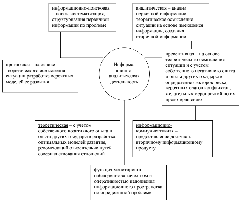
№01 à 2

✓ мониторинга – наблюдение за качеством и оперативностью наполнения информационного пространства по определенной проблеме (схема 2).