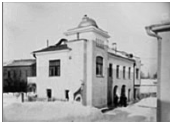
Фото 2. Здание института " Lithogaea " (1910)