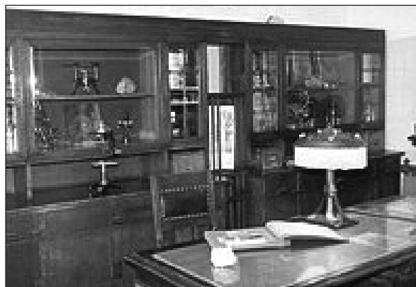
Фото 5. Мемориальный кабинет В.В. Аршинова в ВИМСе

Для технического обеспечения исследований создан мощный современный комплекс аналитических и минералогических высоко-