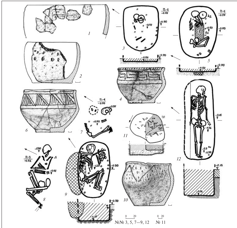
Рис. 1. Підusti, уроч. Мала Кормилиця. Група I, курган 8: 1 — насип, 3, 4 — п. 1; 5 — п. 2; 6, 7 — п. 4; 8 — п. 3; 9, 10 — п. 5; 11 — п. 10; 12 — п. 8; 1, 2, 4, 6, 10 — кераміка