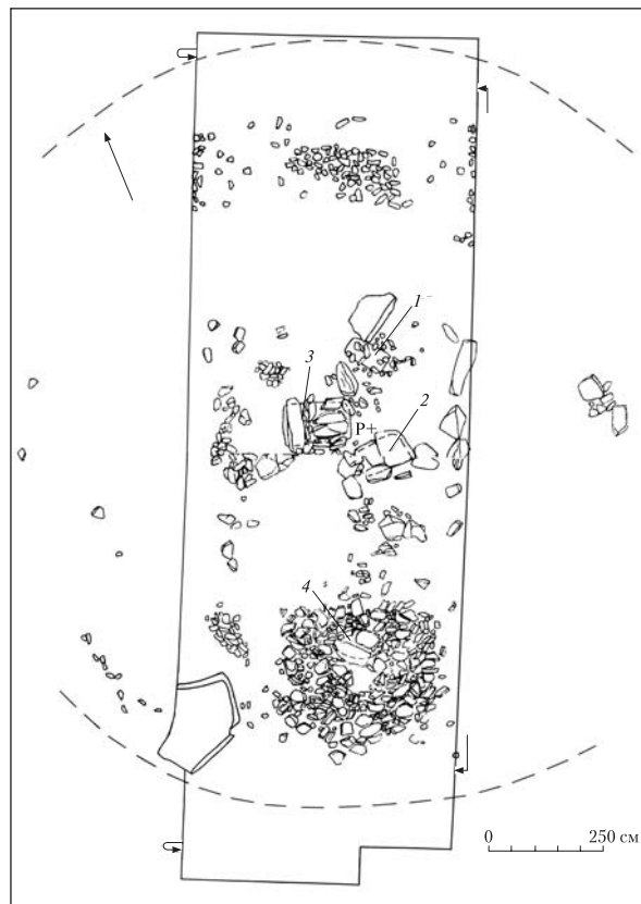
Рис. 3. Курган 2, план: 1—3 — ями, 4 — поховання

Яма 1 — за 1,8 м на північ від R у виймці сучасної грабіжницької міни. Верхня частина зруйнована. На рівні материка вона була овально-видовженою в плані форми, 0,90 \times 0,52 м, дно