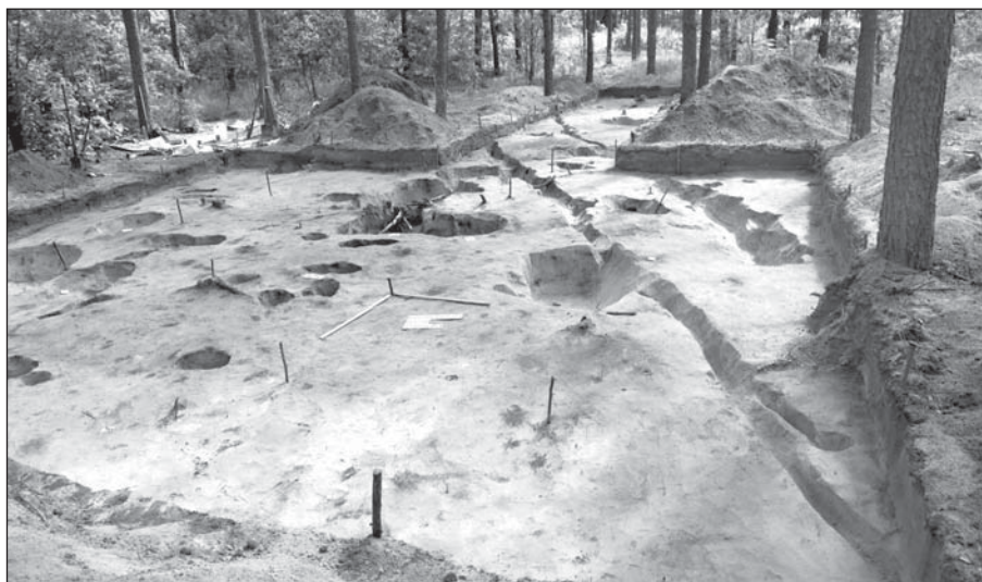
Рис. 3. Загальний вигляд розкопу 21 зі сходу

подібну форму і був заглиблений у материк на 1,7 м (споруда 43). За керамічним матеріалом він датується першою половиною — серединою X ст. З північного заходу до нього прилягала синхронна споруда 42 напівкруглих у плані обрисів, заглиблена в материк на 0,5 м.