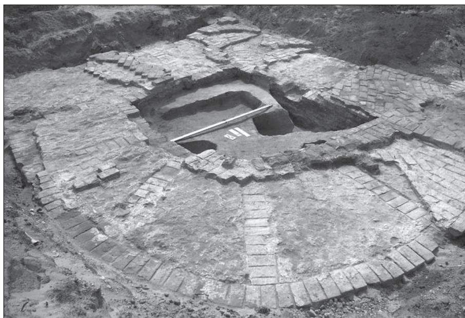
Рис. 2. Батурин. Північна апсида Собору Живоначальної Трійці

Виявлено рештки фундаментів внутрішніх стін палацу, що поділяють підвальний поверх на чотири приблизно рівні частини. Частково розкрито північну стіну основного об'єму палацу, до якої дотикається фундаментний ровик східної частини коридору. На захід від коридору, що вів до основної частини підвалу, в материковому ґрунті розчищено відбитки від дубових колод, що слугували сходишками до підвалу. В цегляній (північній) стіні коридору, що частково збереглася, виявлено гнізда від брусів, що кінцями заходили в кладку стіни.