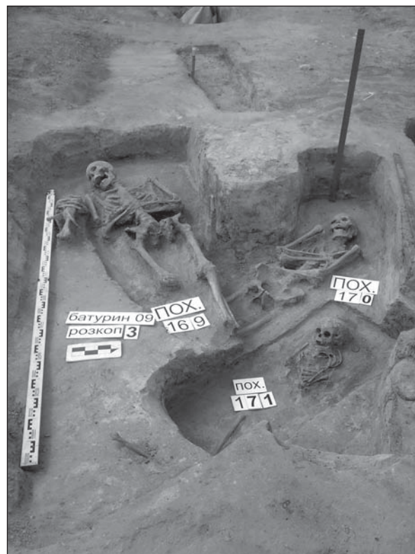
Рис. 1. Батурин. Три горизонти поховань поблизу південної стіни Собору Живоначальної Трійці

У зв'язку з тим, що Указом Президента України від 21.11.2007 р. за № 1131/2007 «Про деякі питання розвитку Національного історико-культурного заповідника «Гетьманська столиця» та селища Батурин» передбачено впродовж