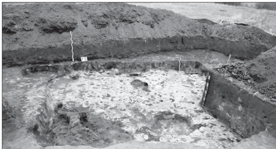
Рис. 1. Селище Пятницкое I. Раскоп 3, жилище

пружинные ножницы и астрагал с насечками в виде руны. Также была доисследована наземная постройка-кухня, угол которой с печью-каменкой был обнаружен в прошлом году. В силу наземного характера постройки ее точную форму определить не представлялось возможным, однако, по имеющемуся материалу, можно предположить, что она была квадратной в плане с длиной стен около 3 м.