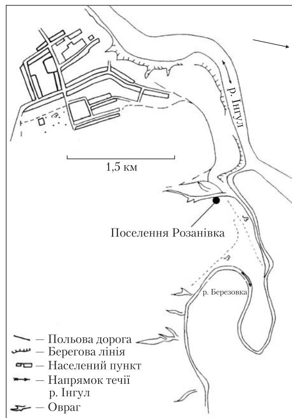
Рис. 1. Поселення Розанівка I. Ситуаційний план

Яма 1 орієнтована по осі північний схід—південний захід і складалася з двох частин. Діаметр північно-східної частини 1,4 м, глибина 0,3 м; південно-західної — 0,85 м, глибина 0,15 м. Південно-західна частина була перекрита кам'яною плитою. Таким чином, яма скла-