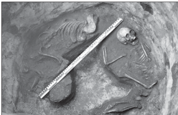
Рис. 1. Харків. Яма з кістяками дітей та собак часів Золотої Орди

Незважаючи на потужне пошкодження давніх культурних шарів та об'єктів, вдалось отримати велику колекцію переважно фрагментованих артефактів козацької доби та часів Золотої Орди (понад 2 тис. од. за польовим описом). Серед особливих знахідок відмітимо срібний диргем хана Узбека 740 р. х. (1339/1340 рр.), карбова-