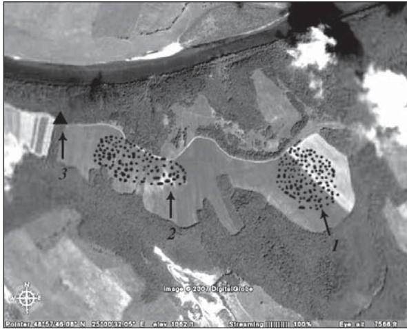
Рис. 1. Пам'ятки поблизу с. Буківна, позначені на супутниковому знімку: 1 — Буківна XVI (мезоліт); 2 — Буківна XV (пізній палеоліт); 3 — курган

знаряддя, представлене комбінованим різцем-скобелем), а також поодинокі відходи (5) і відщепи (24) характерні для пунктів типу майстерень зі спрацьованими нуклеусами, з яких використовували лише пластинчасті сколи. У цілому типолого-статистичний аналіз дозволяє віднести знахідки до доби пізнього палеоліту оріньякоподібного типу, характерного для регіону, і датувати комплекс 20\ 000 \pm 5\ 000 рр. до наших днів.