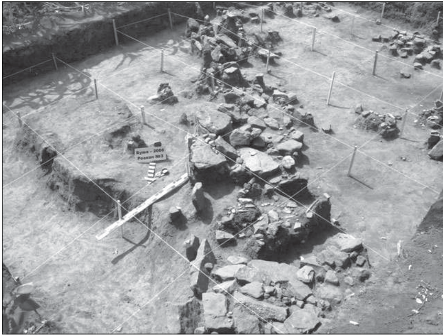
Рис. 2. Загальний вигляд розкопу 3

фіксовано. Поряд розчищено сіру пляму з попелом, мабуть, від вогнища. Частина глини від стіни споруди не випалена зовсім, але в шарі чорнозему залягала поряд із випаленою і тому добре фіксувалася.