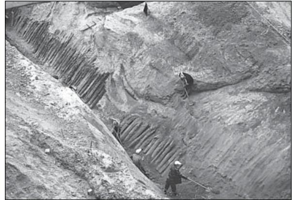
Рис. 3. Дерев'яні конструкції в придонній частині північної ділянки рову Цитаделі

У південній стінці котловану викопано підбій (заготовку під піч, розміри 0,5 \times 0,8 м), не випалений, оскільки піч жодного разу не використовувалась. У котловані зафіксовано стовпові ями та рівчак від конструкції стін. Обидві споруди загинули в пожежі (скоріш за все, 1648 р.), після чого їх котловани були закидані материковою глиною.