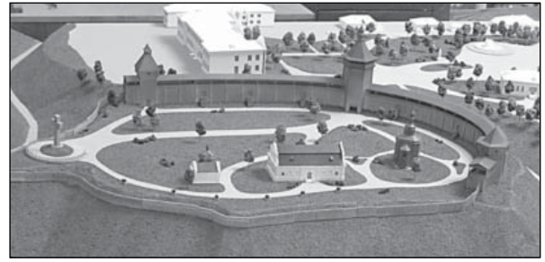
Рис. 2. Батурин. Макет відтворення Цитаделі (Інститут УкрНДІпроектреставрація)

Північне житло (споруда 2) розташоване за 0,7 м від попереднього і досліджене частково ( 4,7 \times 2,6 м, глибина 0,75 м). У західній частині фіксується піч, черень якої виходить на приступку (довжина 2,3 м, ширина 0,5 м) і має продовження у вигляді підбою під материкову стінку котловану. Черень мав розміри 0,45 \times 0,7 м.