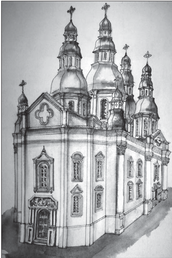
Рис. 3. Батурин. Церква Живоначальної Трійці кінця XVII — початку XVIII ст. (реконструкція В.І. Мезенцева та В.П. Коваленка, мал. С.В. Дмитрієнка)

дальші дослідження, то Троїцький собор можна віднести до самотнього гібридного (?) типу церков козацької держави, де творчо поєднані національні та західні традиції. Його винайшли місцеві майстри в часи інтенсивного церковного будівництва гетьмана І. Мазепи.