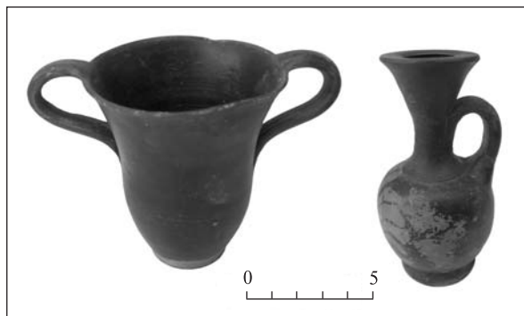
Рис. 1. Инвентарь погребения 10, 2007 г.

В камере найдено четыре скелета (три in situ ). Скелеты лежали вытянуто на спине головой на северо-запад в соответствии с общей ориентацией склепа. Один из них находился в деревянном гробу, остальные — на камышовых подстилках. В юго-восточном углу камеры найден череп лошади. При костяках и в заполнении камеры на уровне дна обнаружены расписная пелика, обломки чернолакового канфара (с ангобом, III в. до н. э.), лезвие железного ножа с выгнутой спинкой, маленькая бронзовая сережка, деталь составного костяного веретена, 21 пастовая бусина (одна полихромная), янтарная полусферическая и гагатовая бусины, вотивный керамический хлебец, раковина каури и пять бронзовых монет (одна